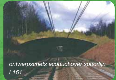
ontwerpschets ecoduct over spoorlijn L161