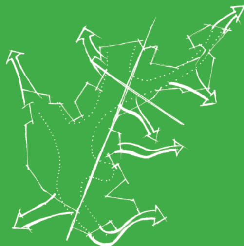
verankering in omgeving