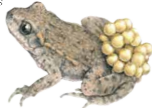
Alytes obstetricans Alyte accoucheur Vroedmeesterpad