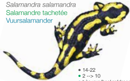
Salamandra salamandra Salamandre tachetée Vuursalamander