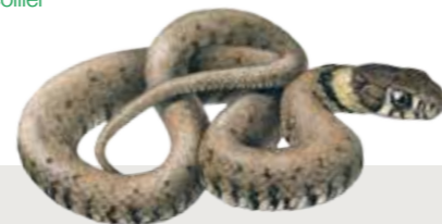
Natrix natrix Couleuvre à collier Ringslang