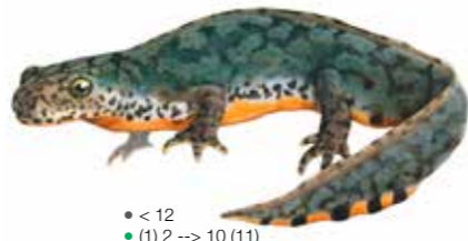
Ichthyosaura alpestris ♀ Triton alpestre ♀ Alpenwatersalamander ♀