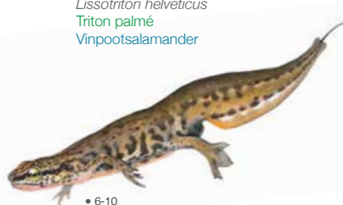
Lissotriton helveticus Triton palmé Vinpootsalamander