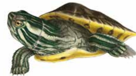
Trachemys scripta troostii Pas de nom vernaculaire Geelwangschildpad