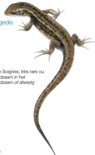
Zootoca vivipara Lézard vivipare Levendbarende hagedis