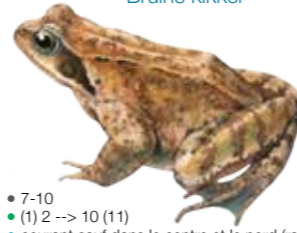
Rana temporaria Grenouille rousse Bruine kikker