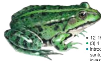
Rana ridibunda Grenouille verte Meerkikker of Grote groene kikker