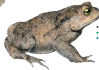
Bufo bufo Crapaud commun Gewone pad