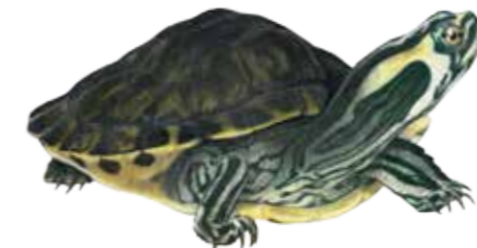
Trachemys scripta scripta Pas de nom vernaculaire Geelbuikschildpad