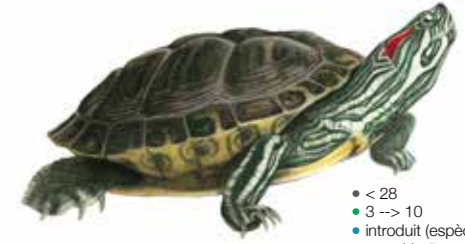
Trachemys scripta elegans Tortue de Floride / Tortue à joues rouges Roodwangschildpad