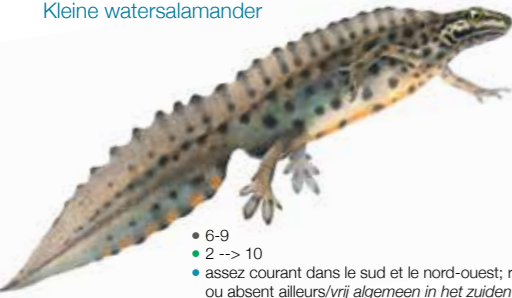
Lissotriton vulgaris Triton ponctué Kleine watersalamander