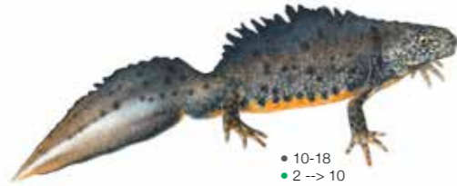
Triturus cristatus Triton crêté Kamsalamander