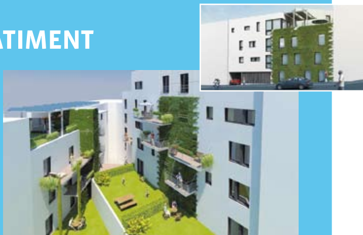
Un des gagnants du concours 2007 : un projet de construction à la Chaussée d'Alseberg.

Suite au succès de l'édition 2007, la Région a lancé un nouvel appel à projet pour la conception et la réalisation de bâtiments exemplaires sur le plan énergétique et environnemental. Pour l'édition 2008, 39 dossiers (locaux administratifs, bureaux, écoles, appartements, maisons unifamiliales...) ont été réceptionnés et seront prochainement soumis à l'avis d'un jury d'experts. Ils représentent une superficie bâtie de presque 120.000 m 2 . Les projets sélectionnés bénéficieront d'une aide financière pour la conception (10€/m 2 ) et la réalisation du bâtiment (90€/m 2 ), ainsi que d'un accompagnement technique.