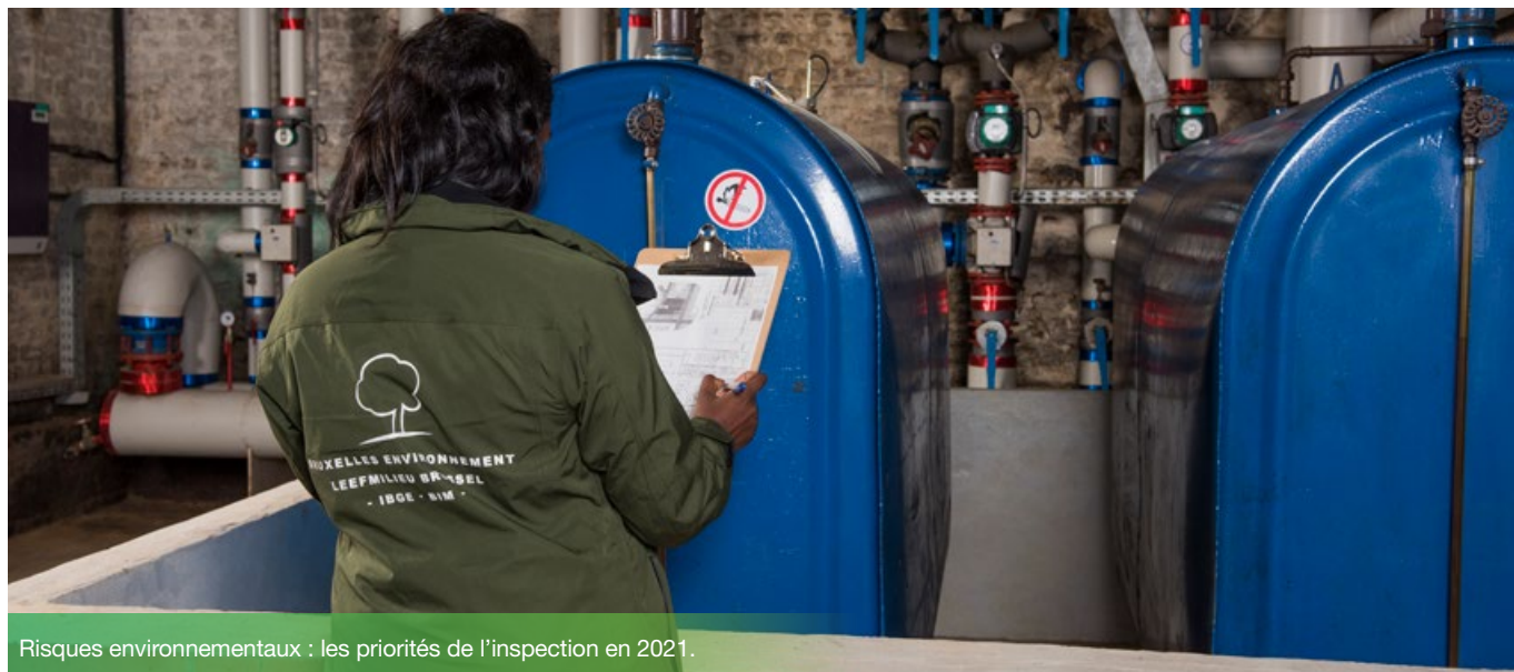
Risques environnementaux : les priorités de l'inspection en 2021.

Comme toute entreprise active sur le territoire de la Région, vous devez respecter les réglementations établies pour prévenir les risques environnementaux. Découvrez le programme annuel d'inspection et les actions phares de 2021 !