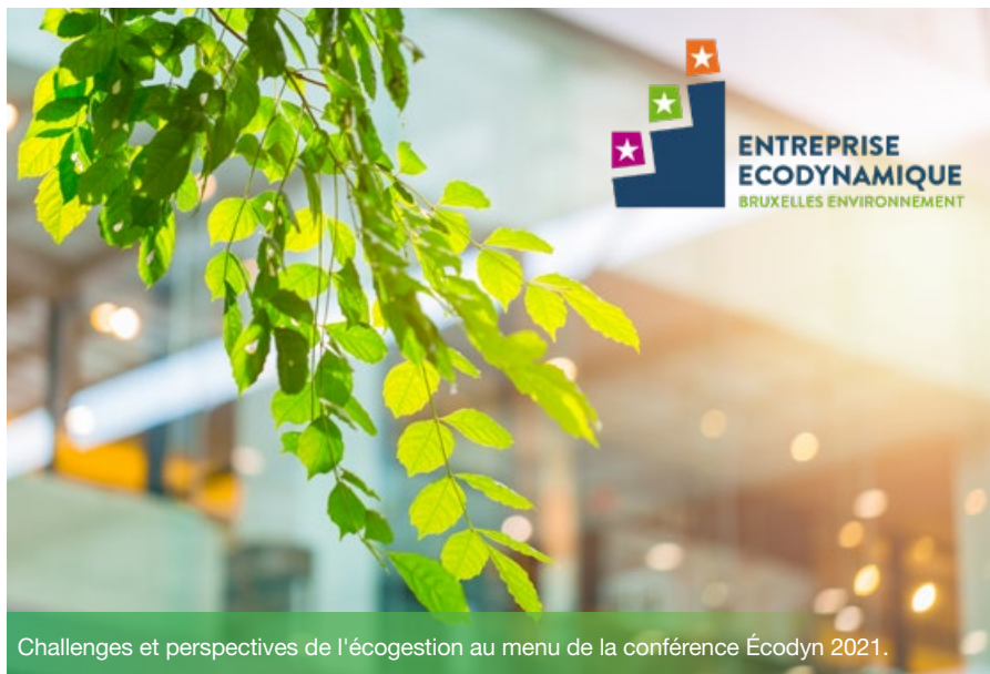
Challenges et perspectives de l'écogestion au menu de la conférence Écodyn 2021.

Quel futur pour l'écogestion ? Tel était le thème de la Conférence Écodyn 2021, organisée en juin dernier. Retour sur une édition centrée sur les challenges et perspectives de l'écogestion et sur la mise à l'honneur des nouveaux labellisés Entreprise écodynamique!