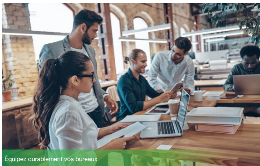
Équipez durablement vos bureaux

Le matériel de bureau nécessite souvent beaucoup de matières premières et d'énergie lors de sa fabrication et de son utilisation. Bien choisir ces équipements peut donc réduire considérablement leur impact environnemental et celui de votre activité. Mais comment s'approvisionner de manière durable ? Sur quels critères se baser lorsqu'on est Responsable Achats ? Lisez plutôt !