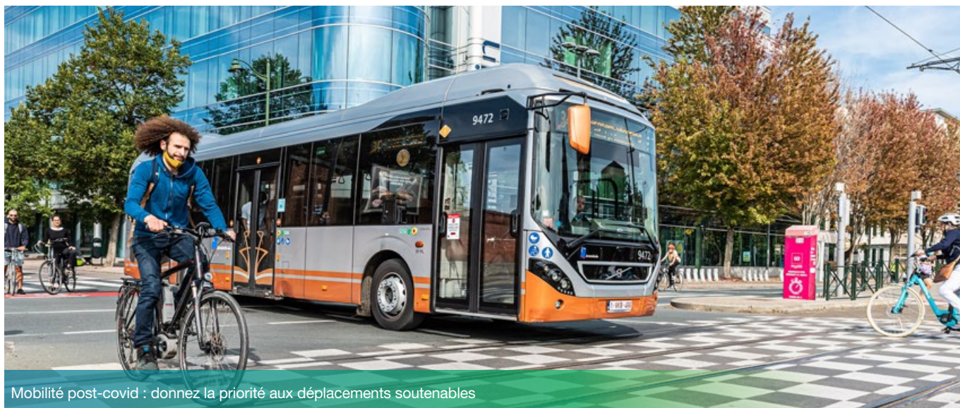
Mobilité post-covid : donnez la priorité aux déplacements soutenables

La mobilité est un enjeu bruxellois majeur. À l'échelle de l'entreprise, elle constitue aussi un véritable défi quotidien et un coût important! Et si vous profitez de la dynamique créée avec la crise sanitaire pour construire une mobilité plus soutenable dans votre entreprise?