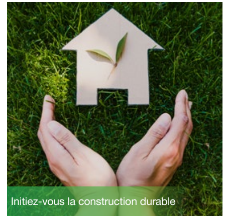
Initiez-vous la construction durable