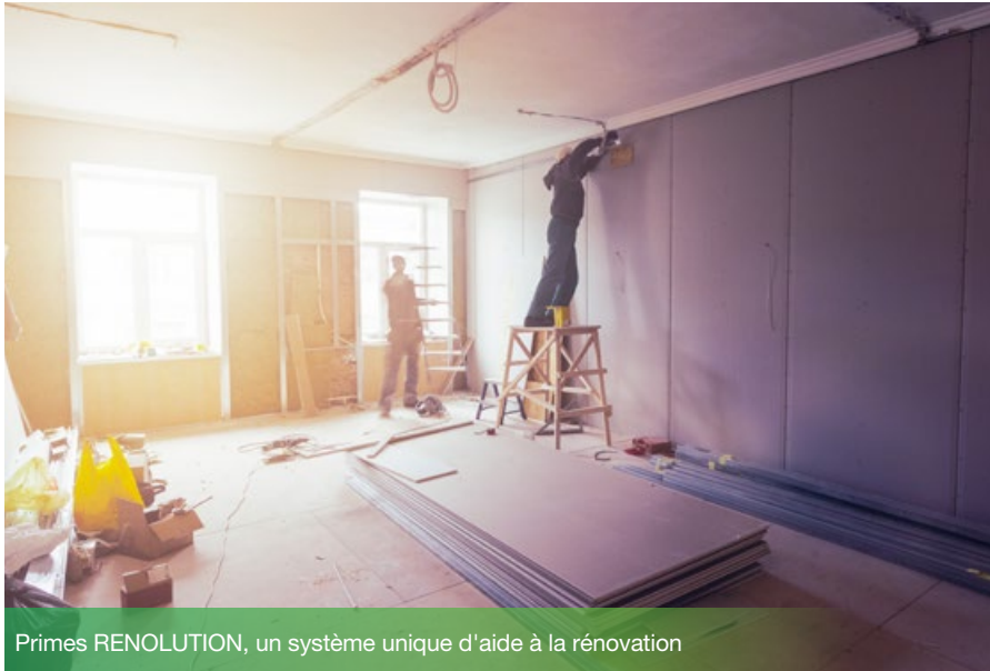
Primes RENOLUTION, un système unique d'aide à la rénovation

Bonne nouvelle pour tous les professionnels, notamment mais pas uniquement les professionnels de la construction et de la rénovation, mais aussi pour les gestionnaires de biens, les copropriétés et collectivités, les personnes morales et physiques propriétaires de biens immobiliers. Il y a du nouveau en matière d'incitants financiers à la rénovation des logements en Région de Bruxelles-Capitale. Depuis le 1 er janvier 2022, les Primes Énergie, Rénovation de l'habitat et Embellissement des façades ont été fusionnées en une seule et même série d'aides: les Primes RENOLUTION! Cette décision s'inscrit dans le cadre de la stratégie du même nom qui vise à diviser par trois la consommation moyenne du bâti bruxellois d'ici 2050. En fonction de la catégorie de revenus à laquelle vous ou vos clients appartenez, vous-même ou vos clients pourrez par exemple prétendre à une prime de 4 250 € à 4 750 € pour l'installation d'une pompe à chaleur, bénéficier d'une aide de 40 € à 140 € du m 2 pour le remplacement de portes et châssis, ou encore d'une aide 20 € à 90 € du m 2 dans le cadre d'une isolation thermique de façade. Attention, ces montants restent sujets à modification jusqu'à leur adoption définitive par le Gouvernement bruxellois prévue au cours du premier trimestre 2022. Les demandes de primes pourront être introduites à partir de mars.