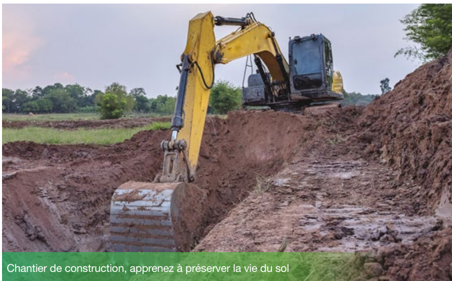
Chantier de construction, apprenez à préserver la vie du sol

Vous êtes entrepreneur, propriétaire, impliqué dans le secteur de la construction ? Découvrez comment préserver un sol vivant dans notre tout nouveau « Code des bonnes pratiques: le sol vivant et les chantiers de construction ».