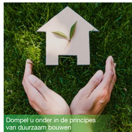
Dompel u onder in de principes van duurzaam bouwen