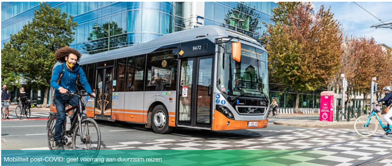
Mobiliteit post-COVID: geef voorrang aan duurzaam reizen

Mobiliteit is een belangrijk thema in Brussel. Voor bedrijven is het zelfs een dagelijkse uitdaging en een aanzienlijke kostenpost. Het kan echter anders. Gebruik het momentum van de gezondheids crisis om de mobiliteit binnen je organisatie te verduurzamen.