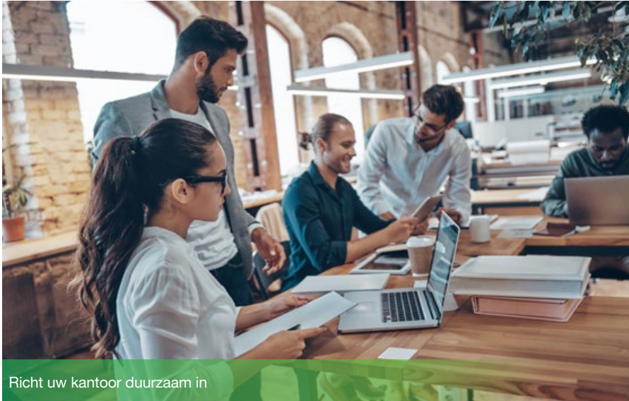
Richt uw kantoor duurzaam in

De productie en het gebruik van kantoomateriaal vraagt vaak veel grondstoffen en energie. Door de juiste keuzes te maken, kan je de milieu-impact van het materiaal, en dus ook van jouw onderneming, aanzienlijk verminderen. Maar hoe kan je duurzaam materiaal inkopen? Welke criteria moet je als aankoopverantwoordelijke hanteren? De antwoorden lees je in dit artikel.