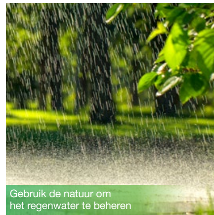
Gebruik de natuur om het regenwater te beheren

Op 22 maart is het Wereldwaterdag. Op die dag organiseert Leefmilieu Brussel de laatste uit een reeks lezingen die op de natuur gebaseerde oplossingen verkennen in de vier Brusselse landschappen: de Dens stad, de Bosstad, de Plattelandsstad en de Waterstad. Op Wereldwaterdag spitst de lezing zich toe op de toekomstige oplossingen van ‘groene en blauwe’ netwerken, de diensten die het waterwegennet levert en de regels voor een geïntegreerd beheer van regenwater. Met op de natuur gebaseerde oplossingen en de groene en blauwe infrastructuur kunnen resistentere gebieden tot stand komen, die in staat zijn om verstoringen in ecologische, economische en sociale systemen op te vangen. De lezing zelf bestaat uit een theoretisch gedeelte in de voormiddag en een terreinbezoek in de namiddag. Het is bedoeld voor landschapsarchitecten, stedenbouwkundigen, architecten, beheerders van groene ruimten, academici, onderzoeksafdelingen, enz.