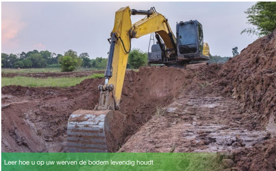
Leer hoe u op uw erven de bodem levendig houdt

Ben je aannemer, eigenaar, actief in de bouwsector? Ontdek hoe je het bodemleven mee in stand houdt in onze gloednieuwe “Code van Goede Praktijk: levende bodem en bouwerven”.