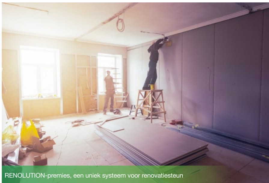
RENOLUTION-premies, een uniek systeem voor renovatiesteun

Goed nieuws voor alle professionals. Zeker voor zij die actief zijn in de bouw- en renovatiesector, maar ook voor beheerders van gebouwen, mede-eigendommen en appartementen, rechtspersonen en particulieren die onroerend goed bezitten. Er is nieuws over de financiële steunmaatregelen voor woningrenovatie in het Brussels Hoofdstedelijk Gewest. Sinds 1 januari 2022 zijn de RENOLUTION-premies de nieuwe overkoepelende naam van de Energiepremies, de Premie voor de renovatie van het woonmilieu en de Premie voor de verfraaiing van gevels. Deze beslissing kadert binnen de gelijknamige strategie om tegen 2050 het gemiddeld verbruik van Brusselse gebouwen door drie te delen. Afhankelijk van de inkomenscategorie kunnen jij of jouw klanten bijvoorbeeld aanspraak maken op een premie van € 4.250 tot € 4.750 voor de installatie van een warmtepomp, € 40 tot € 140 per vierkante meter steun ontvangen voor de vervanging van deuren en ramen, of een premie van € 20 tot € 90 per vierkante meter aanvragen voor de thermische isolatie van de gevel. Let op: deze bedragen kunnen nog wijzigen. De Brusselse regering dient ze nog definitief vast te leggen in het eerste kwartaal van 2022. Subsidieaanvragen kunnen vanaf maart worden ingediend.