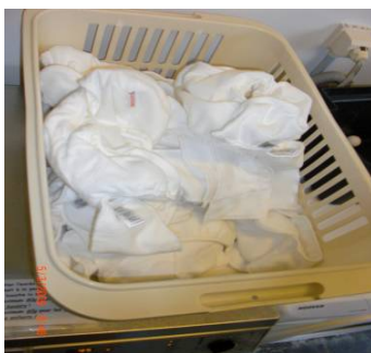
Wasmand met proper gewassen luiers

Als kinderdagverblijf kan u beslissen om de luiers intern of extern te wassen. Externe wasdiensten betekenen echter een meerkost: maar indien dit bijvoorbeeld wordt georganiseerd door uw gemeente kan dit het werk van het personeel wel vergemakkelijken (zie fiche 4 "Nuttige contacten" voor de adresgegevens van wasdiensten in het Brussels Gewest).