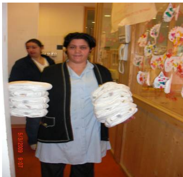
Een kinderverzorgster met propere wasbare luiers

Na een eerste testfase, is het belangrijk om eventjes stil te staan bij eventuele verbeteringen of aanpassingen voor de organisatie bij het gebruiken van de luiers. De kinderverzorg(st)ers en eventueel het personeel dat de luiers wast, zijn hiervoor belangrijke klankborden.