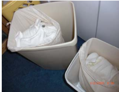
De verschillende vuilbakken met herbruikbare luiers

De stockage vraagt dus meer plaats, maar het is vooral een kwestie van organisatie!