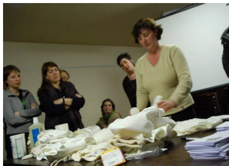
De leverancier toont de verschillende modellen herbruikbare luiers

U kan een leverancier uitnodigen om de verschillende modellen die op de markt zijn te komen "demonstreren". Indien alle actoren betrokken worden bij de keuze van de luiers, bestaat er een grotere kans op slagen.