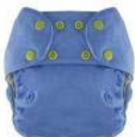
Herbruikbare luier, dat meegroeit "3-in-1" model