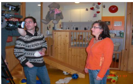
De directrice van het kinderdagverblijf “Les petites étoiles” tijdens een interview met Télé Bruxelles.

Uw eerste ervaringen met herbruikbare luiers kunnen interesse opwekken bij andere kinderdagverblijven, of ouders aanmoedigen om ook thuis herbruikbare luiers te gebruiken voor hun kind.