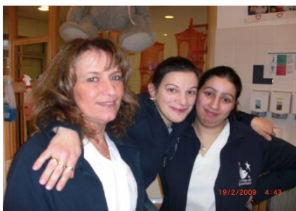
De kinderverzorgsters van “Les petites étoiles” die deelnamen aan het pilootproject

Hieronder vindt u de getuigenissen van de kinderverzorgsters die deelnamen aan het pilootproject, aan het einde van de testfase van één maand.