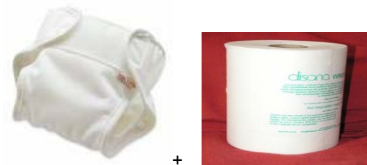
“all-in-one” model: alle laagjes hangen hier aan vast en bevat reeds een extra inlegger + rol afbreekbaar inlegpapier

Deze luiers zijn helemaal voorgevormd en alle ‘laagjes’ hangen eraan vast. Deze modellen zijn praktischer in gebruik, en lijken eigenlijk op wegwerpluiers, maar zijn iets minder duurzaam aangezien alles steeds wordt meegewassen (inclusief extra overbroekje dat hier aan vasthangt). Hun aankoopprijs is ook hoger dan de “klassieke” modellen.