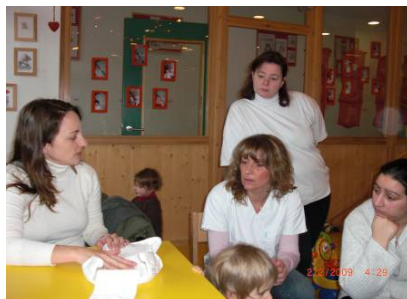
Een informatievergadering waar de leverancier het gebruik van de luiers uitlegt aan de kinderverzorgsters.

U kunt hiervoor ouders of kinderverzorgsters uitnodigen die reeds met wasbare luiers werk(t)en, en zo bijvoorbeeld een demonstratie van wasbare luiers organiseren. De meeste leveranciers of verkopers van wasbare luiers zullen eveneens bereid zijn om meer uitleg te komen geven over wasbare luiers en het gebruik ervan. Een andere mogelijkheid is om een crèche die reeds herbruikbare luiers gebruiken te gaan bezoeken (zie hiervoor Fiche 4 “Nuttige contacten”).