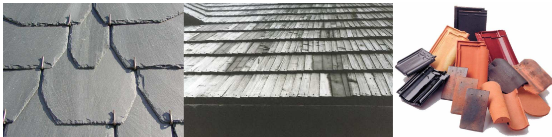
Premier choix: Ardoises naturelles, shingles en bois et tuiles céramiques