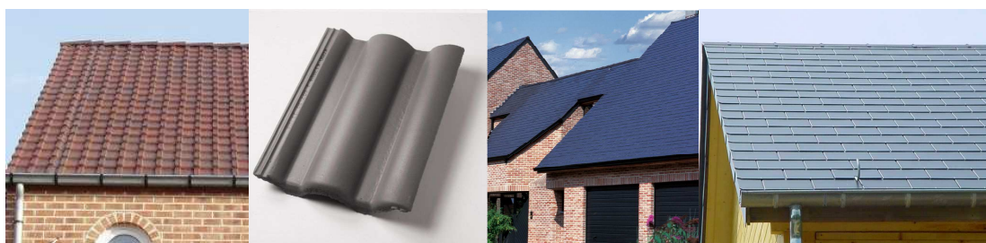
Tuiles en béton (photos 1 et 2); ardoises en fibrociment (photos 3 et 4)