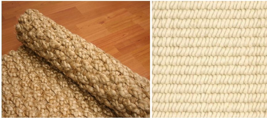
Jute tapijt (1) en kokostapijt (2)

Tapijt voelt warm aan de voeten. De thermische isolatiewaarde van tapijt is tien maal hoger dan die van tegels. Het dempt ook contactgeluid op de vloer.