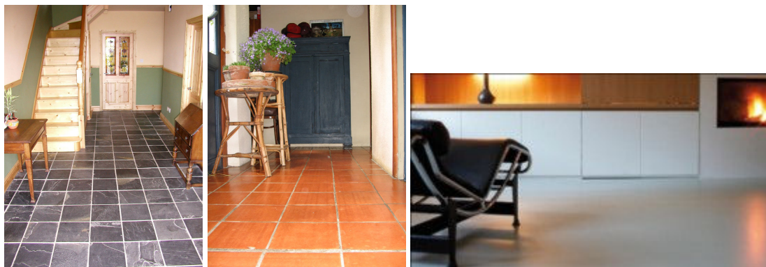
Vloerafwerking in leisteen, keramische tegels en gepolierd beton