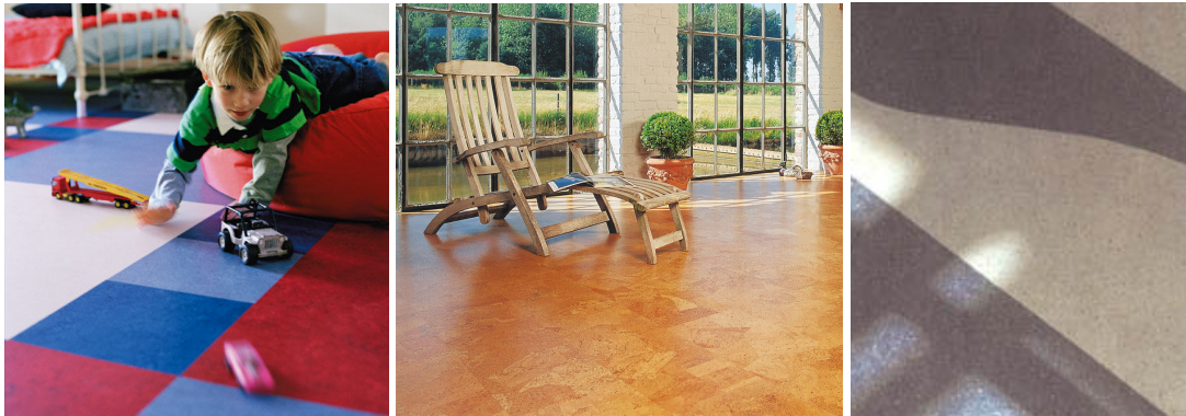
Linoleum (1) en kurk (2) zijn volkomen natuurlijke producten. Vinyl (3) daarentegen is veruit de meest schadelijke vloerbekleding voor de gezondheid.

Net zoals tapijten hebben zachte vloerbekledingen het voordeel dat ze geluidsabsorberend zijn en een warm gevoel geven.