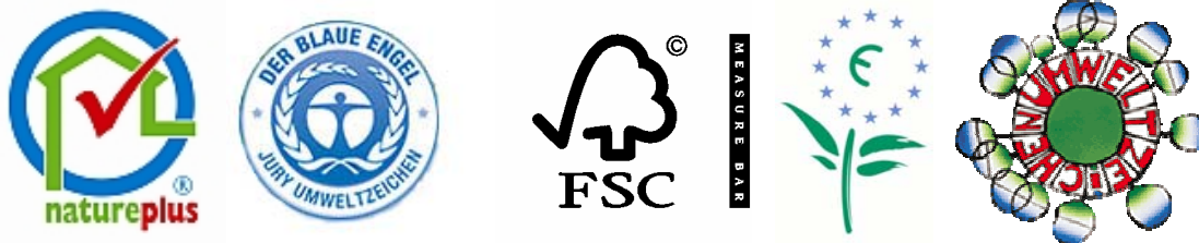
Type I labels: (vlnr) Natureplus, Der blaue engel, FSC, Europees ecolabel, umweltzeichen

Allereerst is er een onderscheid tussen milieulabels en milieuverklaringen. De norm ISO 14020 "Environmental labels and declarations" legt de algemene principes voor milieulabels en verklaringen vast. Er bestaan drie types milieulabels en –verklaringen.