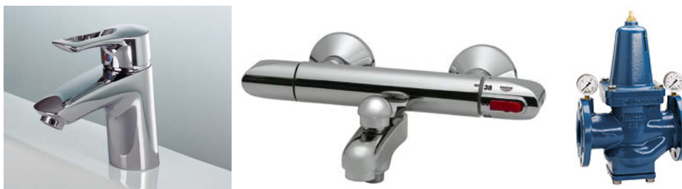
Mitigeur et robinet thermostatique A droite: un réducteur de pression