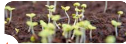
Les légumes qu'on a soi-même cultivés sont plus savoureux et meilleur marché que ceux du commerce.

de radis ; salade liégeoise ; pâtes aux b(l)ettes, ricotta et gorgonzola ; carpaccio de betterave rouge, roquette et radis... En attendant, vous trouverez ci-dessous quelques recettes inédites.