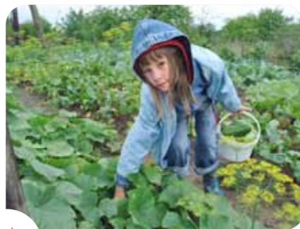
Les enfants aussi prennent plaisir à jardiner.

Le potager collectif est un lieu de convivialité ouvert à tous. Le principe est simple : dynamique collective, implication forte des habitants et participation concrète à son animation régulière (nouvelles plantations, entretien, organisation de fêtes et d'activités annexes...). Le fonctionnement des potagers collectifs en ville s'articule autour des valeurs de solidarité, de convivialité et de tolérance. Les potagers urbains sont aussi un moyen de répondre au besoin de liens sociaux des habitants, et d'être plus proches de la nature. C'est aussi l'occasion de montrer que des friches urbaines peuvent être