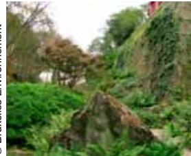
Le Jardin du Pavillon chinois