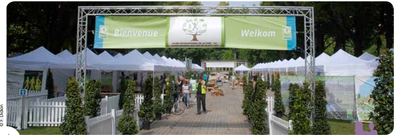
Découvrir, se détendre et prendre plaisir dans un cadre verdoyant. C'est ce qu'a offert la grande Fête de l'Environnement 2011.