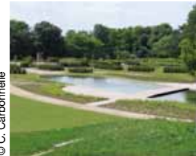
Les Jardins du Fleuriste