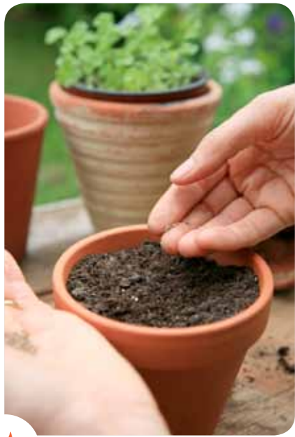
Redécouvrez le plaisir du contact avec la terre...

Les fruits et légumes issus d'un potager écologique présentent de nombreux avantages : plus frais et plus respectueux de l'environnement (ni transport ni stockage nécessaires), plus sains (pas de pesticides) et plus savoureux. En plus, ils sont moins chers que ceux du magasin! Et le manque de temps pour s'en occuper n'est pas un problème : il suffit d'adapter la taille de son potager au temps que l'on peut y consacrer. Quelques pots, un coin dans le jardin ou sur la terrasse et 30 minutes par semaine suffisent pour commencer son propre jardin écologique en ville.