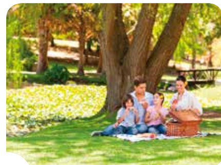
Elke vorm van ontspanning is binnen handbereik met de app Brussels Gardens.

downloaden via bovenstaande QR-codes. De inhoud is ook terug te vinden op www.brussels-gardens.be . Dankzij Brussels Gardens zullen de Brusselse groene ruimten binnenkort geen geheimen meer hebben voor u.