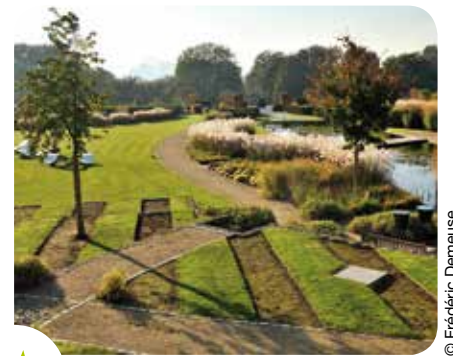
De Tuinen van de Bloemist: design, ontspanning en een prachtig uitzicht.

De wandeling van de koninklijke parken loopt ook door de tuin van het Chinees Paviljoen : een mengeling van exotisme en acclimatisatie met, in het midden van de bloemperken en bosjes, kruiden uit China, Japan en andere streken van Azië en het Midden-Oosten. Tussen de bloeiende heesters zit een klein speelplein met een zandbak verborgen. De tuin bevat prachtige, soms zeer oude rodo-dendronstruiken (tot 70 en 80 jaar oud). Bovendien staan er tussen de vele inheemse soorten ook tal van Aziatische bomen.