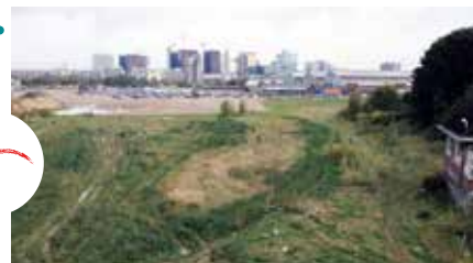
Een voor/na-simulatie van het nieuwe Thurn en Taxis-park vanaf de brug op de Jubelfeestlaan.