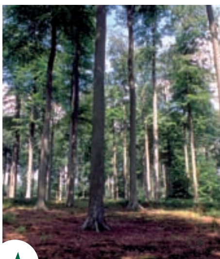
Een bomenkathedraal om te beschermen

www.leefmilieubrussel.be > Particulieren > Groene zones, fauna en flora > Biodiversiteit