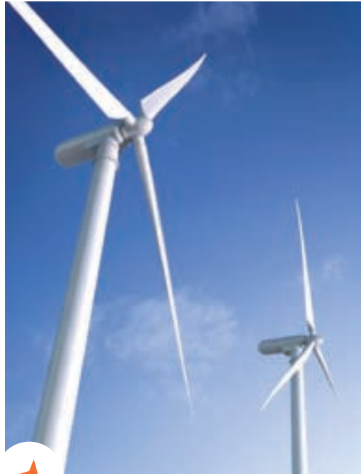
Windmolens voor groene stroom

Info: Brugel, www.brugel.be , 0800 97 198