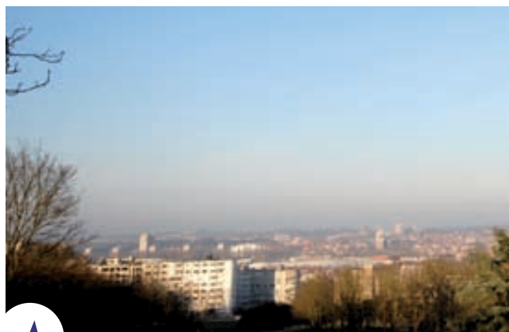
In de nasleep van de conferentie van Bali engageert Brussel zich om de uitstoot van broeikasgassen tegen 2020 met 20 tot 30 % terug te dringen.

Het grootste verschil met de plannen en maatregelen die het Gewest in het verleden heeft genomen, is dat er ditmaal een beroep zal worden gedaan op alle betrokkenen om mee te werken ambitieuze doelstellingen te bepalen en te bereiken