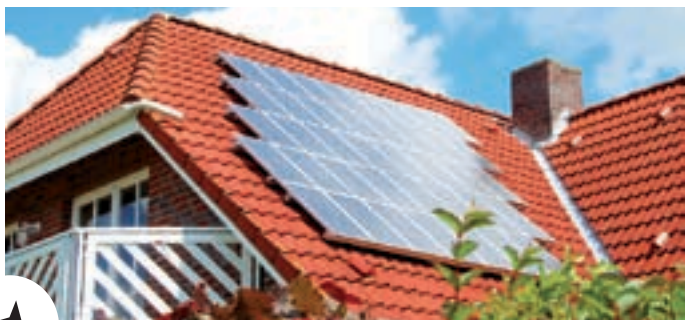
U kunt een premie krijgen voor een zonneboiler en zonnepanelen.