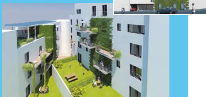
Een van de winnaars van de wedstrijd in 2007: een bouwproject op de Aisembergsesteenweg.

Dankzij het succes van de wedstrijd in 2007 doet het Brussels Gewest opnieuw een projectoproep om gebouwen te ontwerpen en te bouwen die het goede voorbeeld geven inzake milieuvriendelijkheid en energiebeheer. Voor de editie 2008 van de wedstrijd Voorbeeldgebouwen dienden 39 kandidaten een dossier in: administratieve gebouwen, kantoorgebouwen, scholen, appartementen, eengezinswoningen, enz. Binnenkort buigt een jury van experts zich over de inzendingen. Alles samen vertegenwoordigen deze kandidaten bijna 120.000m 2 aan gebouwde oppervlakte. De uiteindelijke laureaten krijgen een financiële tegemoetkoming voor het ontwerpen (€ 10/m 2 ) en het bouwen van het gebouw (€ 90/m 2 ), en daarbovenop ook technische begeleiding bij het project.