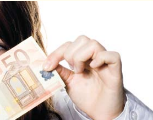
Energiepremies en de belastingvermindering.