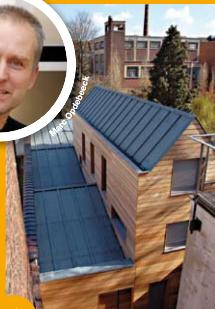
Een oude wasserij werd een lage-energie woning.