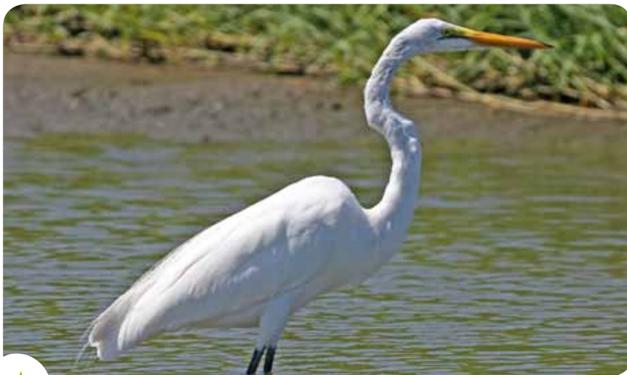
Ardea Alba is de wetenschappelijke naam van de grote zilverreiger.

Sinds drie jaren zien ornithologen deze soort opduiken in Brussel. De witte vogel heeft zelfs al een naam gekregen, 'Eddy', zonder te weten of het elk jaar wel om dezelfde vogel gaat. Met een gemiddelde grootte van 55 tot 65 centimeter en een vleugelbreedte van bijna een meter lijkt Eddy sterk op de reiger, die van nature voorkomt in onze streek. Buiten het feit dat