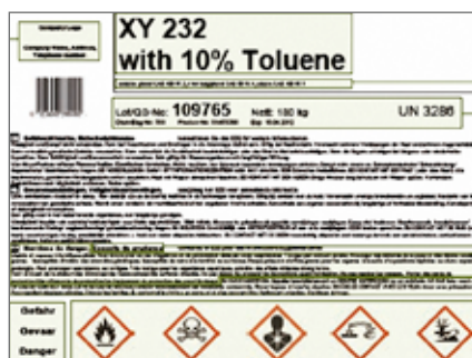
Het nieuwe etiket

Sinds begin 2009 wordt een nieuw etiketteringsysteem stapsgewijs ingevoerd in Europa en de rest van de wereld. Tegen 2015 moeten alle producten met een oud etiket vervangen zijn. Bedoeling is om de classificatie en de etikettering van gevaarlijke chemische pro-