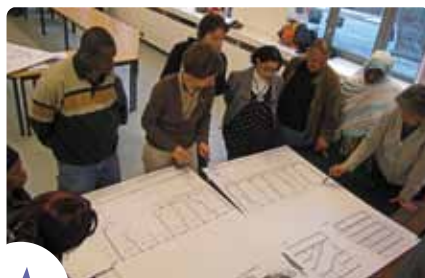
De toekomstige eigenaars waren bij alle keuzes betrokken.