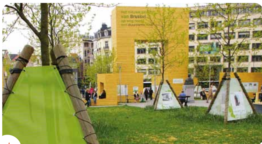
Van Brussel een Europees model van duurzame stad maken.

Brussel doet het uitstekend op het vlak van milieubeheer. Het Brussels Hoofdstedelijk Gewest pakt al jaren de milieu-uitdagingen van de 21 e eeuw aan en dat via tal van projecten. Het doel? Van Brussel een model van duurzame ontwikkeling maken. Ook al blijven er nog een hele hoop uitdagingen, toch hebben de Brusselaars al een mooie dynamiek opgestart. Zo is onze hoofdstad uitgegroeid tot de nummer één onder de 35 Europese hoofdsteden in de green city index, een rangschikking op het vlak van milieubeheer die 'The Economist Intelligence Unit' heeft opgesteld en die door Siemens wordt gesponsord.