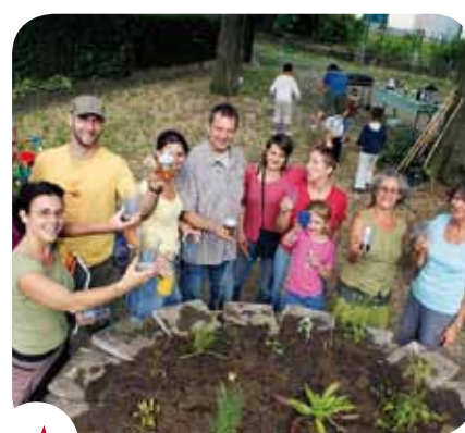
De Brusselaars zijn de belangrijkste krachten van een duurzame stad.