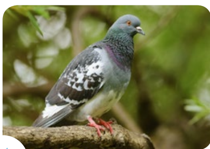
Vermijd stadsduiven te voederen!