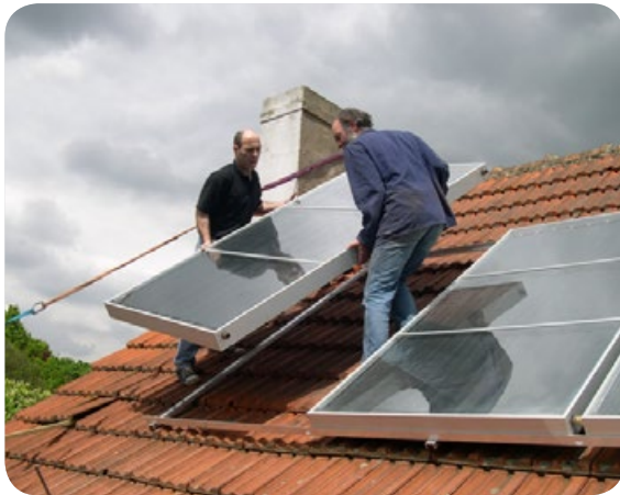
© Ateliers de la rue Voot

In onze contreien heeft een gezin van vier personen voldoende aan 4 m 2 thermische zonnepanelen om te voorzien in 60% van zijn vraag naar sanitair warm water. Les Ateliers de la rue Voot geven Brusselaars de kans om thermische zonnepanelen te bouwen voor hun eigen familiale behoeften. Tijdens een opleidingscyclus van 12 sessies krijgt u, samen met anderen en in een ontspannen sfeer, alle tips en tricks omtrent zonnepanelen en leert u ze zelf te installeren.