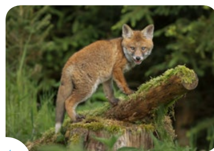
De vos en de overgrote meerderheid van de dieren die vrij in de natuur leven kunnen zich zeer goed alleen behelpen om voedsel te vinden.

De horrorverhalen van een bruine beer die toeristen heeft gebeten in een natuurpark in het westen van Canada of van een onverwachte aanval van een haai langs de oevers van de Rode Zee in Egypte kunnen vaak op dezelfde manier worden verklaard: door hen te voederen, heeft de mens zijn relatie verstoord met dieren die vrij in de natuur leven. Dieren die er beetje bij beetje aan gewend zijn geraakt om voedsel te krijgen van de mens, zijn niet langer bang voor hun natuurlijke vijand en vallen aan als ze niet het voedsel vinden waarnaar ze op zoek zijn. In onze contreien zijn er geen beren of haaien, maar het zet wel aan tot nadenken. Hoe vaak worden hier mensen niet verrast door groepen onverschrokken, opdringerige duiven of door de aanwezigheid van agressieve kraaien of zwerfkatten, ratten en soms zelfs vossen. De relatie tussen mens en dier is aan het veranderen: vermijd dan ook het rechtstreeks en onrechtstreeks voederen van dieren die vrij in de natuur leven.