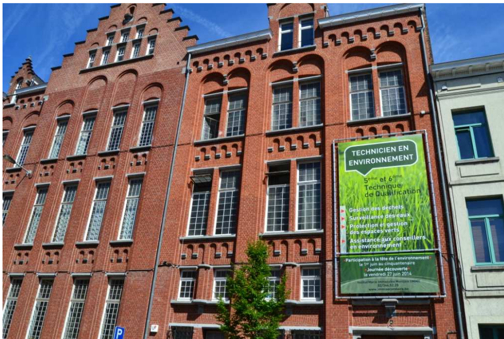
Vanop straat kan je de technische specialisatie van het IMMI onmogelijk missen

Yan besluit: “Het was de eerste keer voor ons en voor de leerkrachten en we hebben er het goed vanaf gebracht. Er zijn nog werkpunten. Het is goed om weten dat we nog zaken kunnen bijsturen.” De leerlingen geven met veel plezier de fakkel door aan de lagere klas en verheugen er zich op hun trucs en tips te delen. Een mooi staaltje solidariteit.