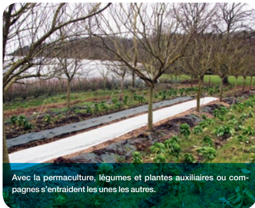
Avec la permaculture, légumes et plantes auxiliaires ou compagnes s'entraident les unes les autres.