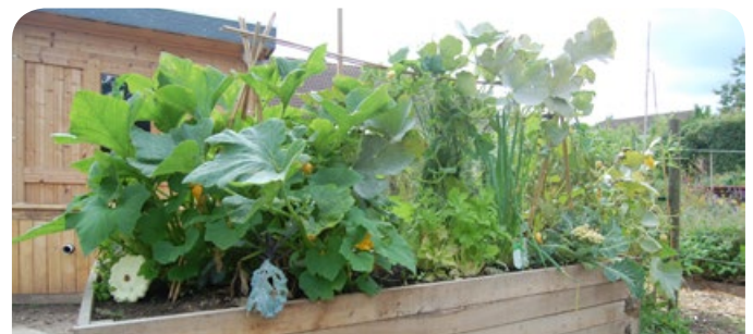
Jard'Inspiration stelt modelmoestuinen voor die u thuis kunt namaken. Maar er is meer! U vindt er ook talrijke tips en tricks om water te recupereren, restjes te composteren, het gebruik van externe middelen zoveel mogelijk te beperken.