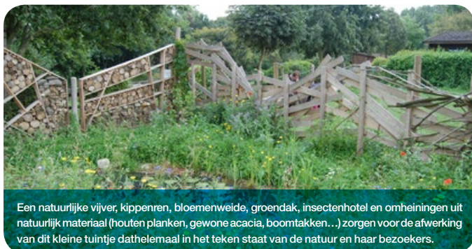
Een natuurlijke vijver, kippenren, bloemenweide, groendak, insectenhotel en omheiningen uit natuurlijk materiaal (houten planken, gewone acacia, boomtakken...) zorgen voor de afwerking van dit kleine tuintje dat helemaal in het teken staat van de natuur en haar bezoekers.

De Jard'Inspiration van Boerderij Nos Pilijs werd gecreëerd om te tonen dat men ook op een andere manier in de stad kan tuinieren: zonder pesticiden en meststoffen, door de natuur en wat 'onkruid' zijn werk te laten doen, met technieken die iedereen aankan, waarvoor zelfs geen tuin nodig is, ... Dat is nog steeds het doel, en door ecologisch te tuinieren, zoals deze modeltuinen promoten, kan men niet voor de hand liggende gewassen telen op heel kleine oppervlaktes: fruit, groenten, planten die de biodiversiteit bevorderen... Altijd op een duurzame en ecologische manier. "Boerderij Nos Pilijs wil de bezoekers inspireren, ze tonen hoe ze thuis op een eenvoudige manier iets gelijkaardigs kunnen realiseren, hun vooroordelen doorprikken, hun gedrag veranderen, de soorten van bij ons leren kennen en gebruiken", vertelt ons Etienne Duquenne, hoofd van het tuinbedrijf van de Boerderij.