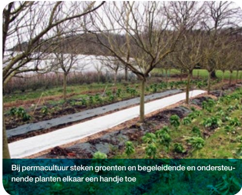
Bij permacultuur steken groenten en begeleidend en ondersteunende planten elkaar een handje toe