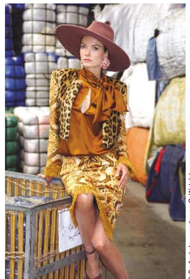
© Spullenhulp - creatie van G. Watelet