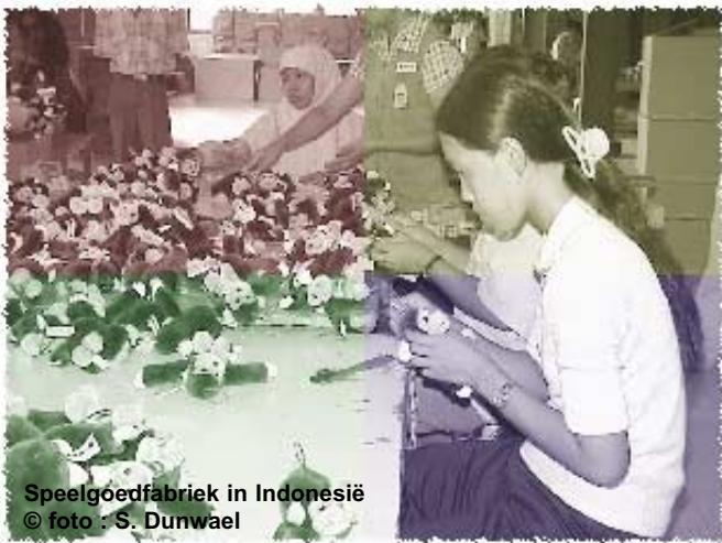
Speelgoedfabriek in Indonesië

Meer dan de helft van het speelgoed dat in Europa wordt verkocht, komt uit Azië (Thailand, Indonesië, China), omdat arbeid er minder duur is. Wist u dat een arbeider uit die landen 2 maanden moet werken om 100 euro te verdienen, het bedrag dat u elk jaar uitgeeft aan het verwennen van uw kinderen? (bron: Oxfam).