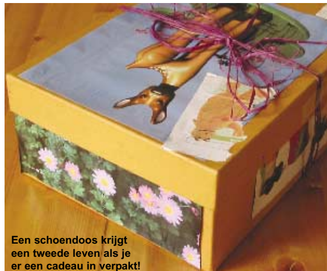
Een schoendoos krijgt een tweede leven als je er een cadeau in verpakt!

Speelgoed is altijd mooi opgesierd ... Niet alleen de cadeauverpakkingen zelf, maar ook de doos waarin het speelgoed zit en die vaak groter is dan nodig. Deze verpakkingen eindigen snel in de vuilnisbak, maar het papier en het karton kunnen gerecycleerd worden (in de gele zak). Een tip voor milieuvriendelijker verpakkingen? Koop gerecycleerd geschenkpapier of gebruik kranten- of tijdschrijfpapier met mooie illustraties ... gegarandeerd origineel!