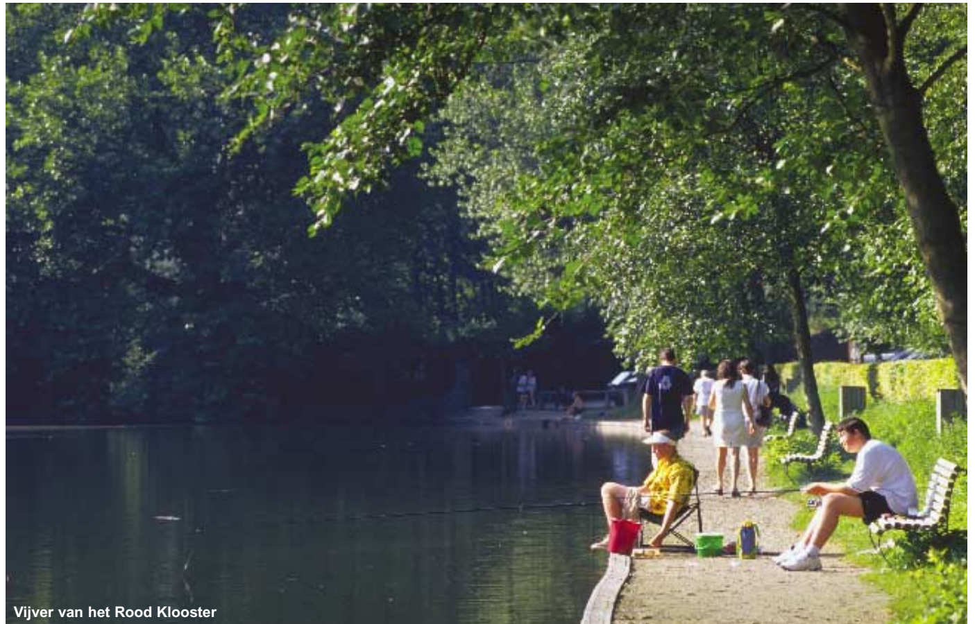
Vijver van het Rood Klooster