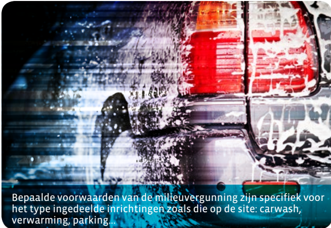
Bepaalde voorwaarden van de milieuvergunning zijn specifiek voor het type ingedeelde inrichtingen zoals die op de site: carwash, verwarming, parking...