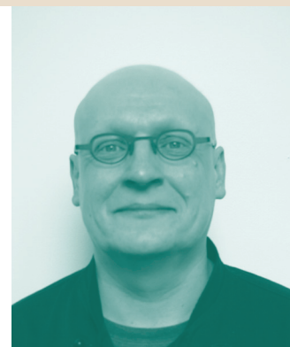
(le génie créatif de la cuisine)

Sur base des constats du projet pilote, nous savons que pendant les premiers mois, c'est surtout la créativité du chef de cuisine qui sera mise à l'épreuve.