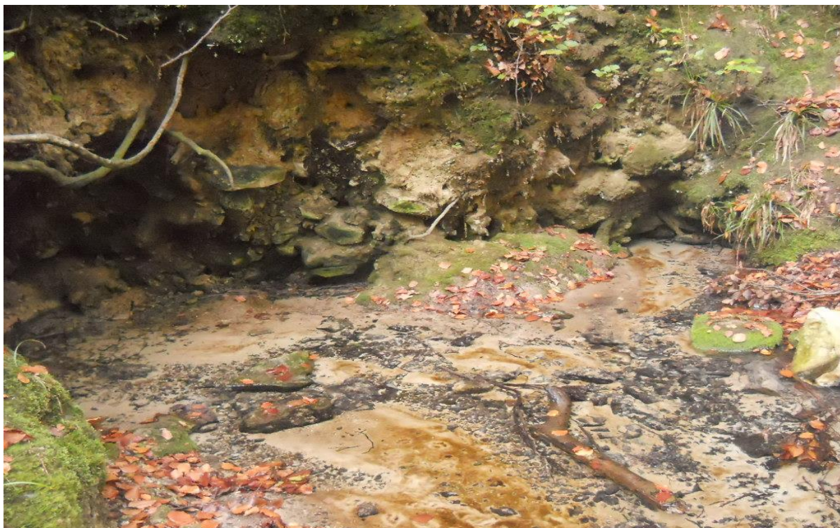
Keizersbron (Zoniënwoud)

Bovendien moet de Brusselse Regering overeenkomstig artikel 36, § 3, van de kaderordonnantie zorg dragen voor de nodige bescherming van de aangewezen waterlichamen met de bedoeling de achteruitgang van de kwaliteit daarvan te voorkomen, teneinde het niveau van zuivering dat voor de productie van drinkwater is vereist te verlagen.