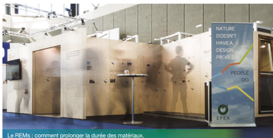
Le REMs : comment prolonger la durée des matériaux.