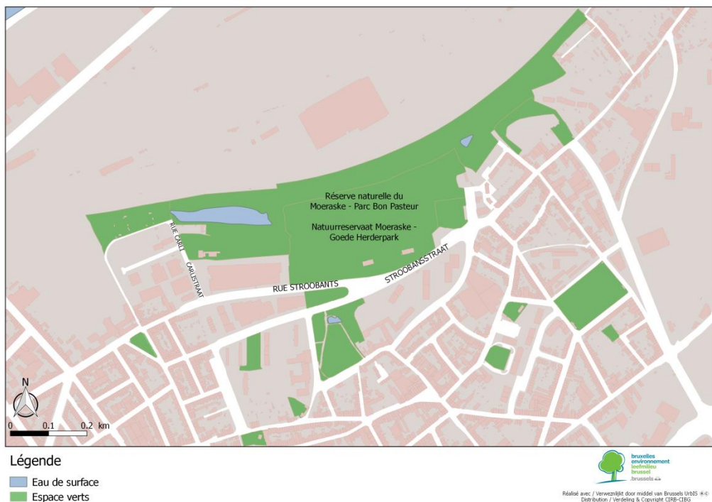
Figure 1 : Localisation de la zone.

Propriétaire : Le site est la copropriété de la SNCB, de la commune d'Evere et de la Région de Bruxelles-Capitale.