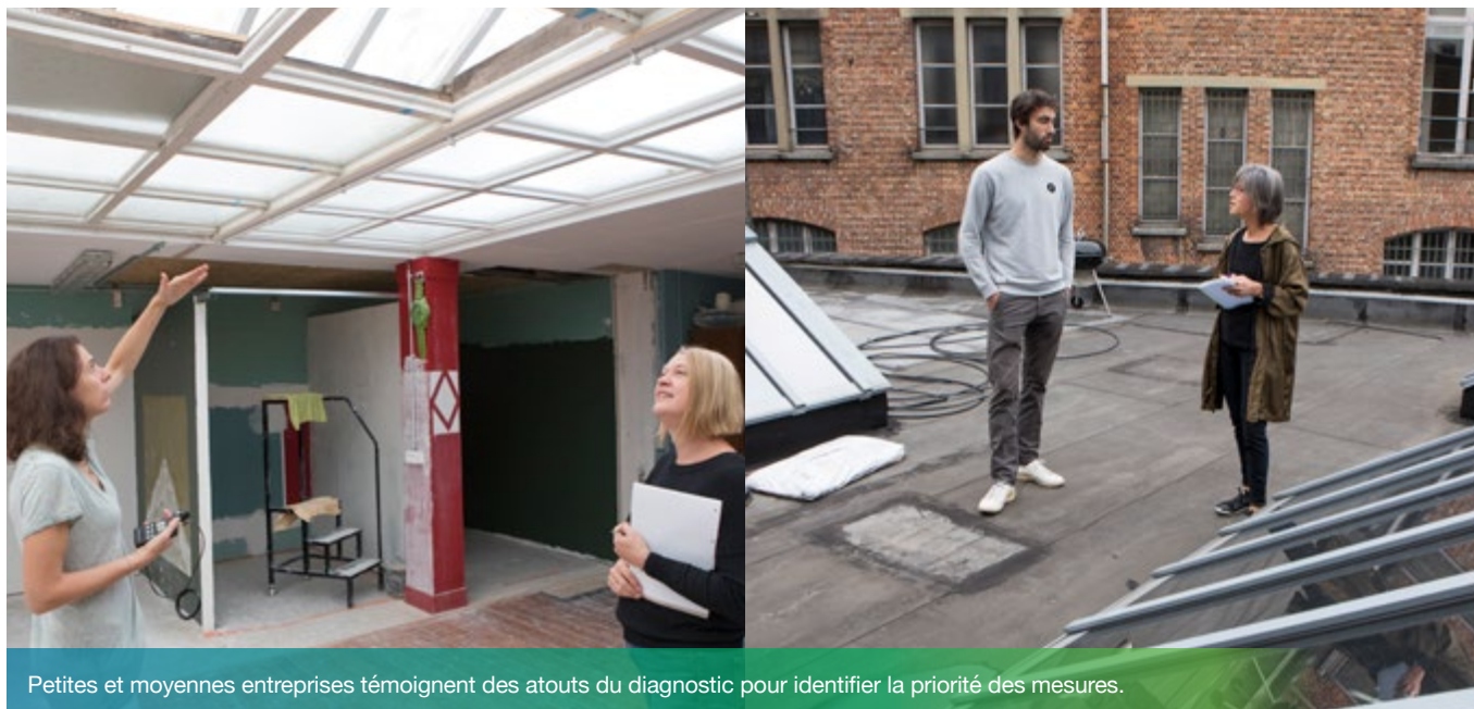
Petites et moyennes entreprises témoignent des atouts du diagnostic pour identifier la priorité des mesures.

Retrouvez plus de témoignages sur www.packenergie.brussels