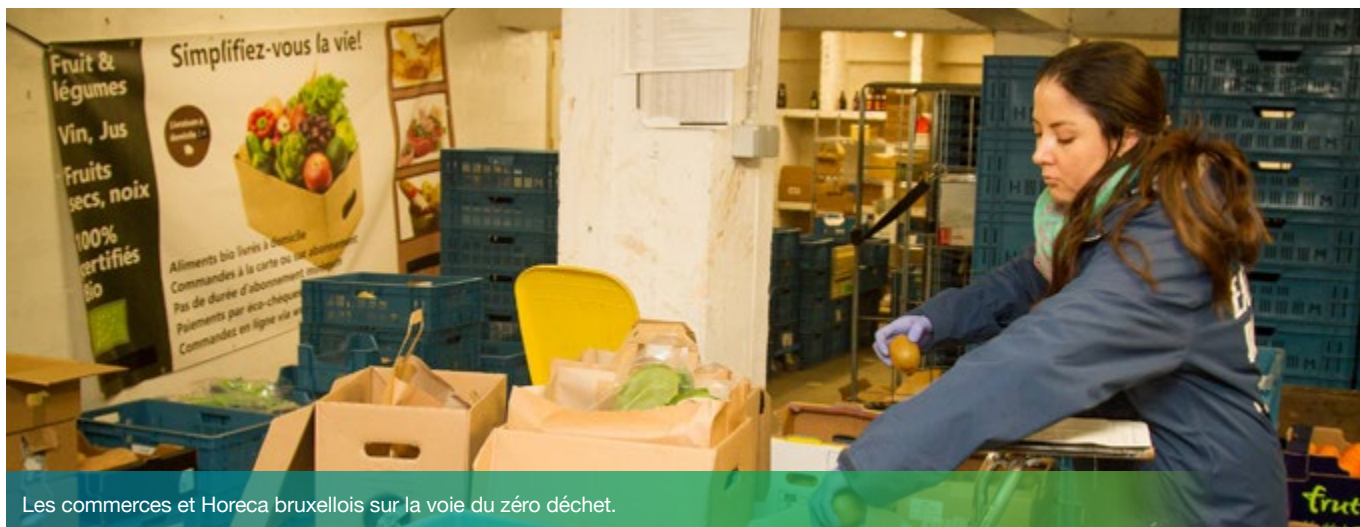
Les commerces et Horeca bruxellois sur la voie du zéro déchet.

Vrac, contenants réutilisables, consignes... A la demande de plus en plus de client-es, la vague du zéro déchet déferle sur les commerces alimentaires et l'Horeca bruxellois. Malgré le climat incertain lié à la crise sanitaire, 51 établissements ont ainsi déposé leur candidature pour la 2 ème édition de l'appel à projets « Horeca et commerces alimentaires zéro déchet » : un chiffre presque équivalent à celui de l'édition précédente qui illustre la proactivité du secteur ! Découvrez les projets inspirants des 19 établissements lauréats en 2020.