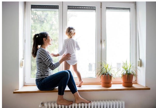
Figuur 1: ouder en kind kijken door het raam met een radiator onder de voeten.

Dit is tevens een voorwaarde om de energiepremie te verkrijgen.