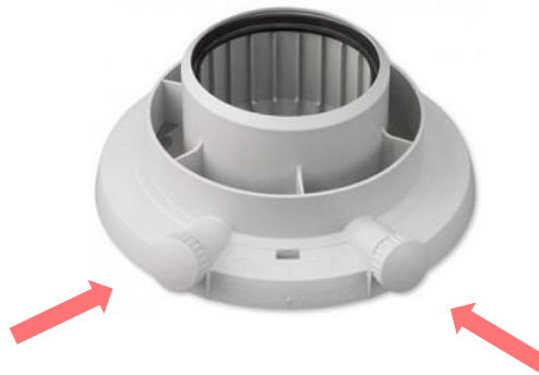
Figuur 3: Afbeelding van een toebehoren dat moet worden geplaatst op een concentrisch aanvoer- en afvoerkanal dat is voorzien van 2 meetgaten.

Deze gaten worden gewoonlijk verkregen door het plaatsen van een onderdeel geleverd door de fabrikant, onder andere in geval van concentrische kanalen. Indien de luchttoevoer- en rookgasafvoerkanalen gescheiden zijn, kunnen zij tevens door uw installateur worden aangebracht.