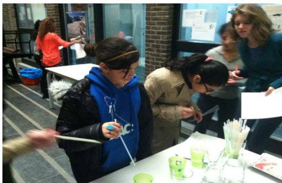
L'épreuve de l'eau potable.

KTA Jette participe également depuis plusieurs années à la Semaine européenne de la Réduction des Déchets . Durant cette semaine, l'école propose une salade de fruits frais à un prix très démocratique. Les élèves de 5 ème en sciences sociales et techniques en ont fait un véritable 'Fruity Cool Day'. Les 100 portions ont été vendues en un quart d'heure! Voilà un exemple de collation saine et produisant peu de déchets: tous les déchets de fruits ont été compostés et la salade de fruits a été servie dans les gobelets réutilisables de Bruxelles Environnement.