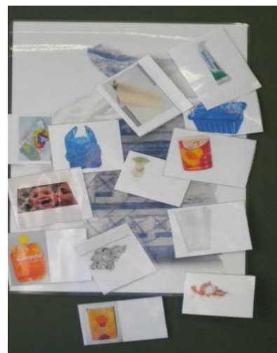
Goed sorteren is de boodschap op KTA Jette!

Ondanks het feit dat de drankautomaten op de speelplaats werden verwijderd, blijft de speelplaats er op sommige momenten zeer vuil bijliggen. Daarom is er een schema vastgelegd waarbij de speelplaats tweemaal per week door een bepaalde klas wordt schoongemaakt. Om deze karwei te vergemakkelijken heeft de school afvalgrijpers aangekocht.