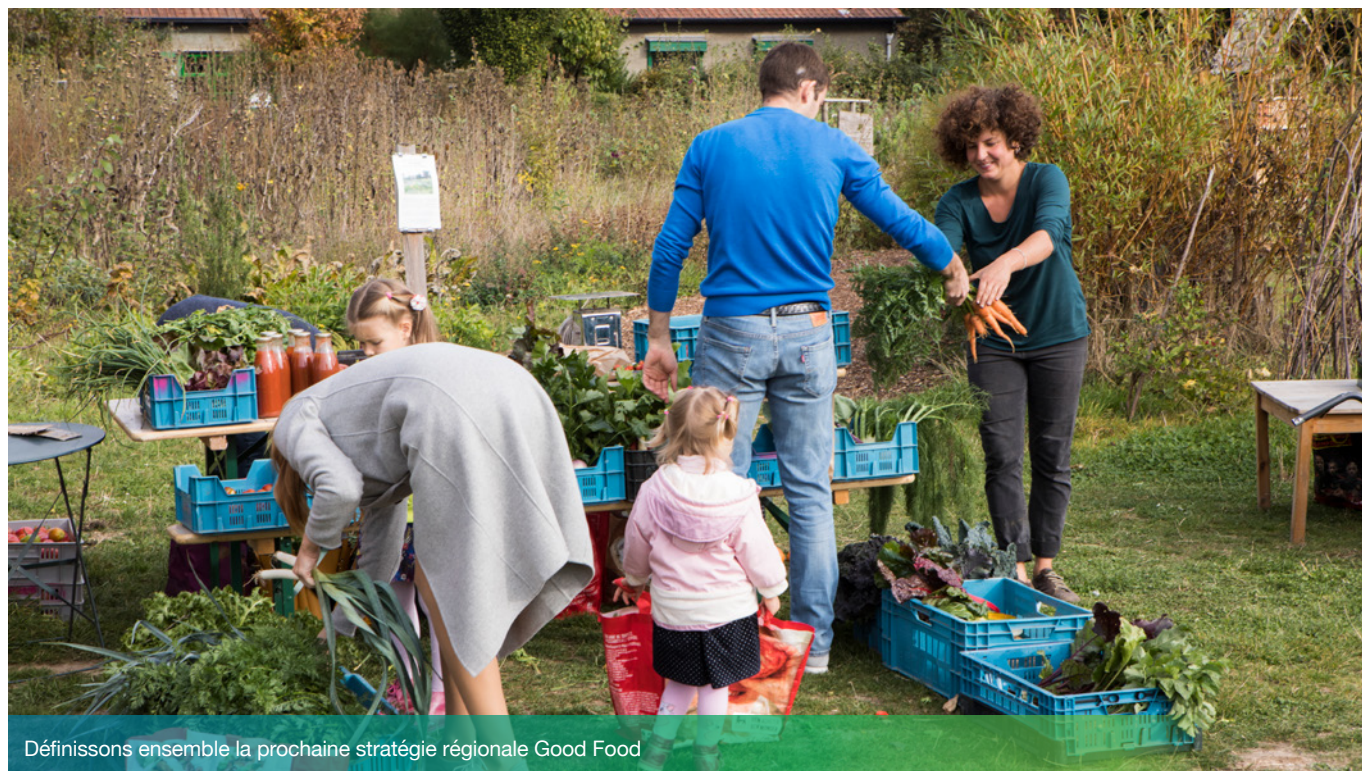
Définissons ensemble la prochaine stratégie régionale Good Food

Tirer les leçons de l'expérience Good Food permettra de faire des recommandations pour définir la nouvelle stratégie. Elle sera élaborée en cohérence avec la Déclaration de politique régionale 2019-2024, notamment en terme de lutte contre les changements climatiques, d'adaptation aux caractéristiques de la population et du territoire bruxellois, et de transversalité avec les enjeux de santé, d'action sociale et de développement économique. La nouvelle stratégie devrait être publiée début 2022.