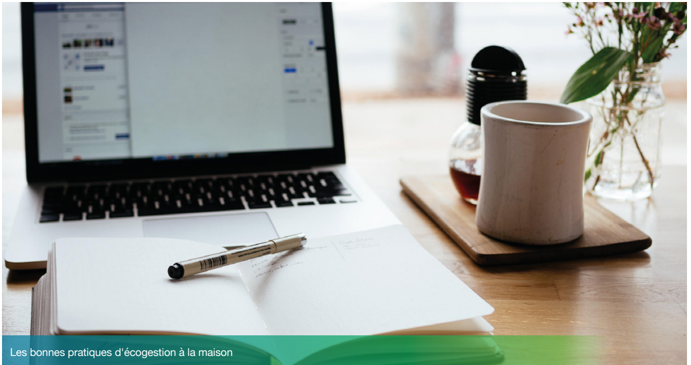
Les bonnes pratiques d'écogestion à la maison

Les mesures de confinement liées à la pandémie de Covid-19 ont projeté une bonne partie des employé·e·s de la Région dans une organisation 100% télétravail. Au programme, plus que jamais : vidéoconférences, streaming, échanges par mail... Et si on ramenait à la maison les bonnes pratiques d'écogestion du bureau, notamment en matière d'IT ? Voici quelques pistes pour limiter le coût environnemental du télétravail.