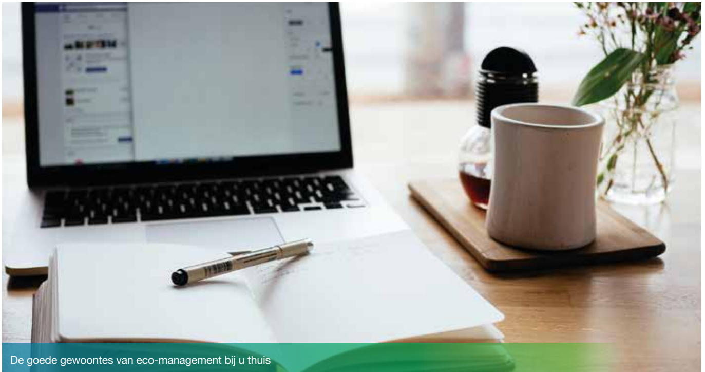
De goede gewoontes van eco-management bij u thuis

Door de lockdownmaatregelen rond de COVID-19-pandemie is een groot deel van de werknemers in het Gewest in 100% telewerkmodus terechtgekomen. Meer dan ooit op de agenda: videoconferenties, streaming, e-mailverkeer, ... Wat als we ook thuis de beste praktijken zouden toepassen op het gebied van eco-management, vooral op IT-gebied? Hier zijn enkele manieren om de milieulast van telewerken te beperken.