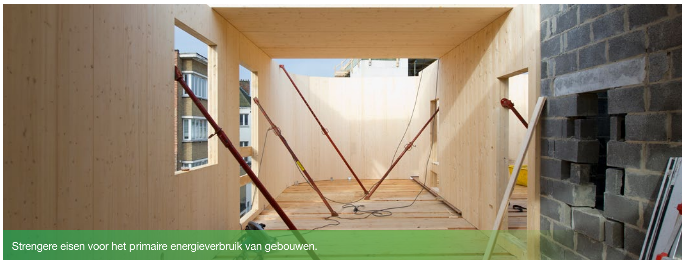
Strengere eisen voor het primaire energieverbruik van gebouwen.

De Europese doelstelling is dat nieuwe gebouwen vanaf 2021 bijna energieneutraal zijn. Daarom gelden er vanaf 1 januari 2021 strengere eisen voor het primaire energieverbruik van nieuwe of gelijkgesteld met nieuwe niet-residentiële gebouwen. Hetzelfde geldt voor de isolatie-eisen van bepaalde wanden: er zijn wijzigingen op komst voor bouwprojecten met nieuwe eisen in het verschiet voor 2022!