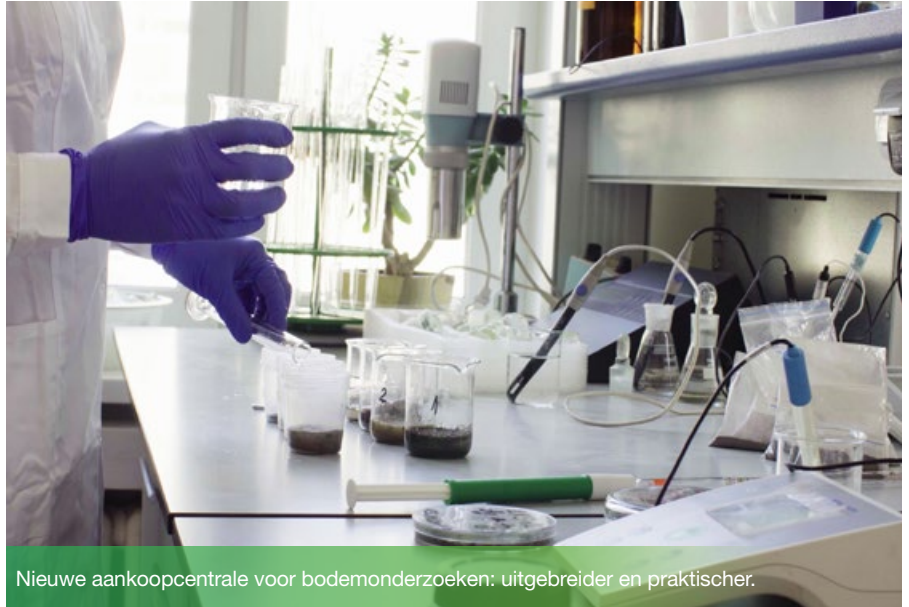
Nieuwe aankoopcentrale voor bodemonderzoeken: uitgebreider en praktischer.

De gloednieuwe aankoopcentrale voor bodemonderzoeken is operationeel. Ze is in het leven geroepen om overheidsorganisaties te helpen die onderworpen zijn aan de regels inzake overheidsopdrachten en is in verschillende opzichten verbeterd.