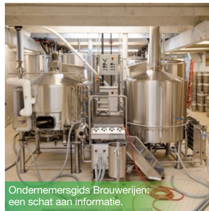
Ondernemersgids Brouwerijen: een schat aan informatie.

Ken jij de Ondernemersgidsen? Deze vademecums beschrijven de specifieke exploitatievoorwaarden voor de meest voorkomende ingedeelde inrichtingen: carwash, ondergrondse stookolietank, koelinstallatie, enz. Ze informeren de exploitanten van deze installaties over de specifieke verplichtingen die uit de milieuvergunning voortvloeien en helpen hen bij de naleving ervan. De nieuwste toevoeging aan deze reeks is de Ondernemersgids voor Brouwerijen! Ze is op jou van toepassing als je een brouwerij, een werkplaats voor het bereiden of verpakken van al dan niet alcoholhoudende dranken, een opslagplaats voor vaten of fusten bier, enz. uitbaat. In deze gids verneem je welke verplichtingen je hebt wat betreft het pand, de exploitatie en de buurt, de producten en het afval.