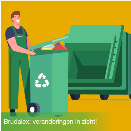
Brudalex: veranderingen in zicht!

Als afvalbeheerder, winkelier of producent van niet-huishoudelijk afval (bedrijf, overheidsinstantie, vzw, enz.) ken je waarschijnlijk de Brudalex (Bruxelles/Brussel-Déchets-Afvalstoffen-LEX). Deze tekst geeft het Brussels Hoofdstedelijk Gewest een wettelijk kader dat de overgang naar een circulaire economie mogelijk maakt door de administratieve lasten te verminderen en de selectieve inzameling en het hergebruik van afval te bevorderen. Het is deze tekst die onder meer het verbod op het gebruik van plastic zakken voor eenmalig gebruik heeft ingesteld. De Brudalex wordt momenteel bijgewerkt. Er zijn belangrijke wijzigingen gepland met betrekking tot de sorteerverplichtingen voor bedrijven, onder meer op het gebied van voedingsafval, compostering, het beheer van afval uit de gezondheidszorg of plastic producten voor eenmalig gebruik die zijn opgenomen in de SUP-richtlijn en de uitgebreide producentenverantwoordelijkheid (UPV). Ontdek wat er zoal voor jou verandert in de volgende editie van de BEN en op leefmilieu.brussels > news .