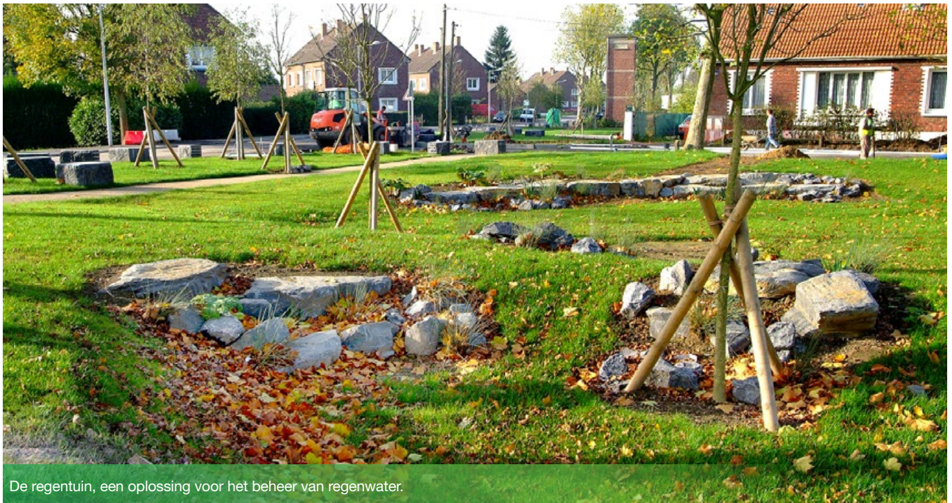
De regentuin, een oplossing voor het beheer van regenwater.

In 2022 lanceert Brussel haar plan voor Geïntegreerd Regenwaterbeheer (GRB). Het doel is het regenwater in de stad op een meer natuurlijke manier beheren om zo de stad beter bestand te maken tegen overstromingen. Om van dit plan een succes te maken, is de steun van een groot aantal professionals nodig. Jullie kunnen hiervoor rekenen op verschillende tools en de nodige begeleiding.