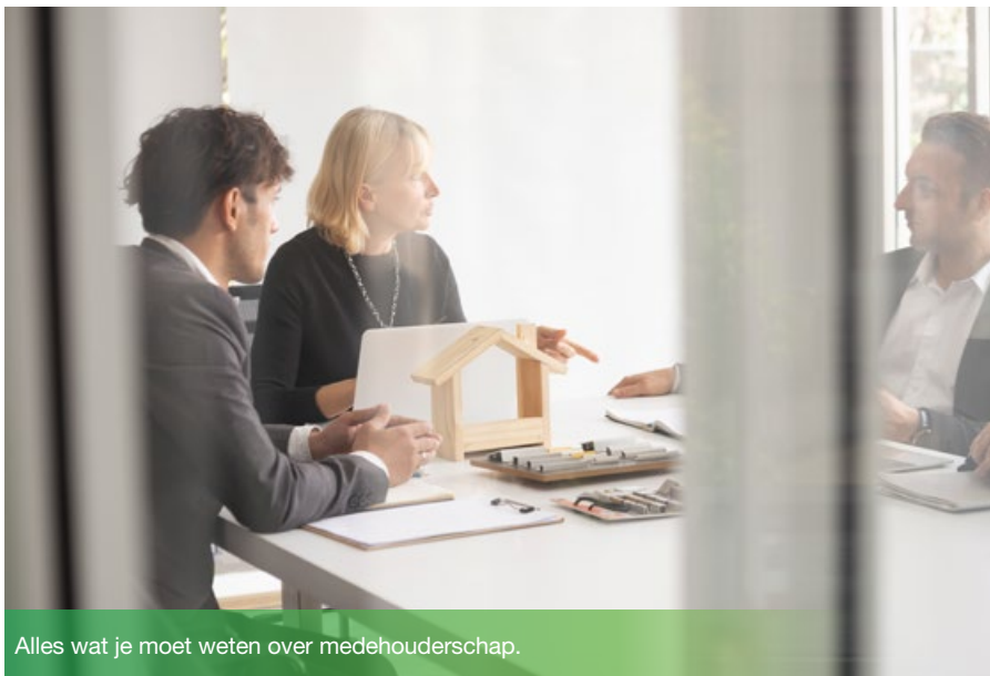
Alles wat je moet weten over medehouderschap.

Ben je betrokken bij een milieuvergunning? Wist je dat deze vergunning aan meerdere natuurlijke en/of rechtspersonen tegelijk kan worden afgegeven? Dit staat bekend als medehouderschap.