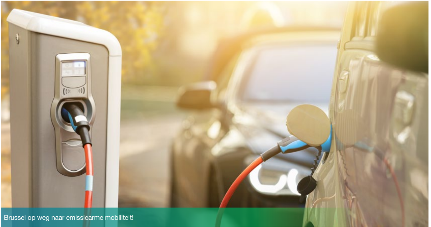
Brussel op weg naar emissiearme mobiliteit!

Het tijdschema voor de lage-emissiezone (LEZ) ligt vast. Voor auto's en lichte bestelwagens valt het doek voor dieselmotoren in 2030, en voor benzine-, LPG- en CNG-motoren in 2035. Bovendien heeft het Gewest met zijn "Roadmap Low Emission Mobility" een strategie goedgekeurd die gericht is op mobiliteit zonder directe emissies. Ontdek wat dit betekent voor professionals en welke steunmaatregelen er bestaan om dit doel te bereiken.