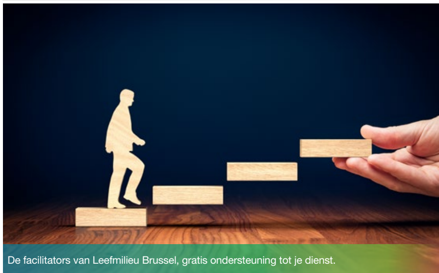
De facilitators van Leefmilieu Brussel, gratis ondersteuning tot je dienst.

Wil je graag ondersteuning voor jouw milieubeheersinitiatieven? Zoek je antwoorden op technische vragen? Je kan hiervoor terecht bij de facilitators en coaches van Leefmilieu Brussel, stuk voor stuk experts in de meest uiteenlopende domeinen. Je vindt er gratis helpdesks en coaching. Hier is alvast een kleine selectie.