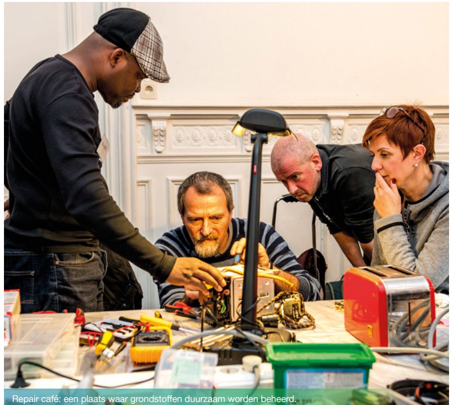
Repair café: een plaats waar grondstoffen duurzaam worden beheerd.

In overleg met de private en openbare afvalprofessionals zal het Gewest hun acties plannen en begeleiden om te beantwoorden aan de behoeften van het Gewest.