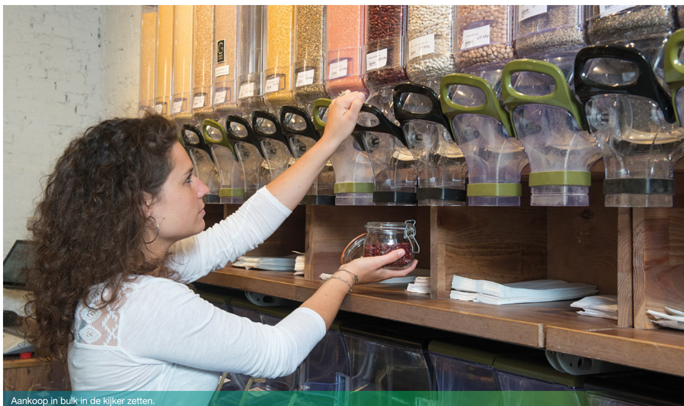
Aankoop in bulk in de Kijker zetten.