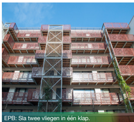
EPB: Sla twee vliegen in één klap.

leefmilieu.brussels/epb > EPB voor verwarming en klimaat