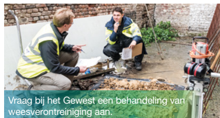
Vraag bij het Gewest een behandeling van weesverontreiniging aan.

operatoren zijn de voordelen van de publieke behandeling onmiskenbaar, aangezien Leefmilieu Brussel alle kosten van de onderzoeken en behandeling van de weesverontreiniging van de bodem op zich neemt. Vanuit financieel oogpunt is het systeem gelijkaardig aan het systeem van een ziekenfonds. Het bedrag van de bodemattesten maakt het mogelijk een reserve op te bouwen die vervolgens wordt gebruikt om bodemsanering te financieren. Voor 2019 bedraagt het budget 165.000 euro.