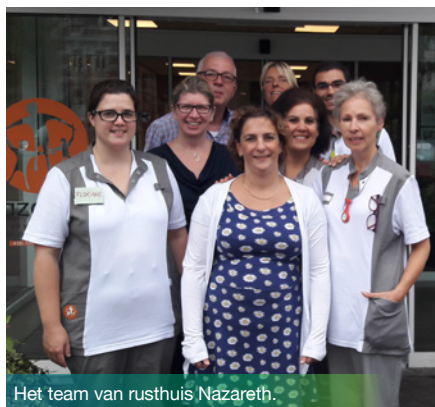
Het team van rusthuis Nazareth.

De teams van energieadviseurs zullen hun expertise met u delen door het organiseren van bezoeken ter plaatse, een follow-up en energiecoaching. Deze diensten zullen u helpen de investeringsprioriteiten te bepalen en alle mogelijkheden voor een verminderd verbruik voor uw gebouwen te identificeren.