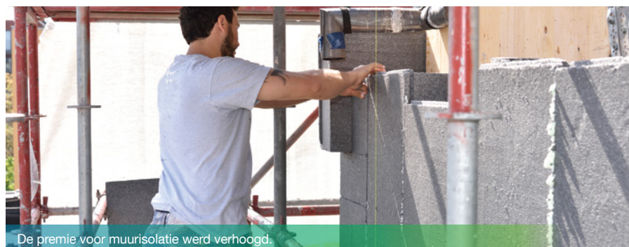
De premie voor muurisolatie werd verhoogd.

leefmilieu.brussels/aanvraagcategoriepremie