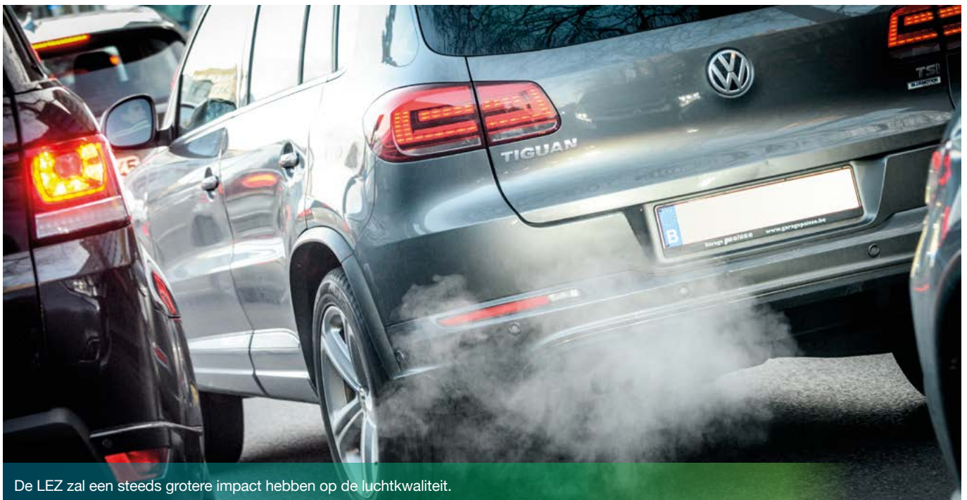
De LEZ zal een steeds grotere impact hebben op de luchtkwaliteit.

Meer informatie over de resultaten van de LEZ op www.lez.brussels/nl