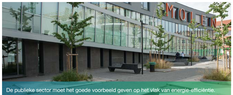
De publieke sector moet het goede voorbeeld geven op het vlak van energie-efficiëntie.

Voor informatie over EPB-verwarming: leefmilieu.brussels/epb > EPB voor verwarming en klimaat