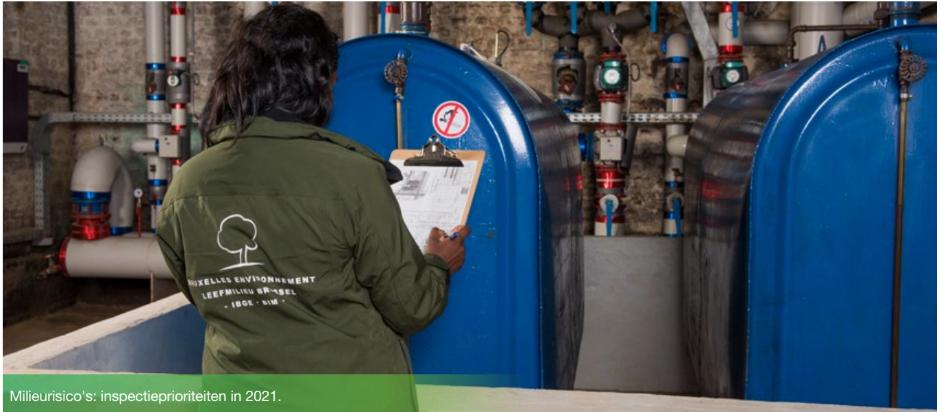
Milieurisico's: inspectieprioriteiten in 2021.

Elk bedrijf dat in het gewest actief is, moet de milieuwetgeving naleven, een reeks van regels die zijn vastgelegd om milieurisico's te voorkomen. Ontdek het jaarlijkse inspectieprogramma en de belangrijkste acties voor 2021!