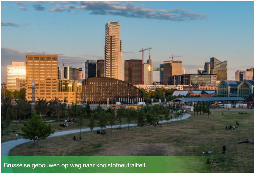
Brusselse gebouwen op weg naar koolstofneutraliteit.

Prioriteit voor het klimaat! Met de strategie RENOLUTION wil het Brussels Hoofdstedelijk Gewest de renovatie van gebouwen versnellen. Het doel is het gemiddelde verbruik van woningen tot een derde reduceren. Maar de strategie mikt verder dan dat en richt zich tot alle Brusselse gebouwen. Van de industriële en tertiaire sectoren en de overheid worden nog grotere inspanningen verwacht.