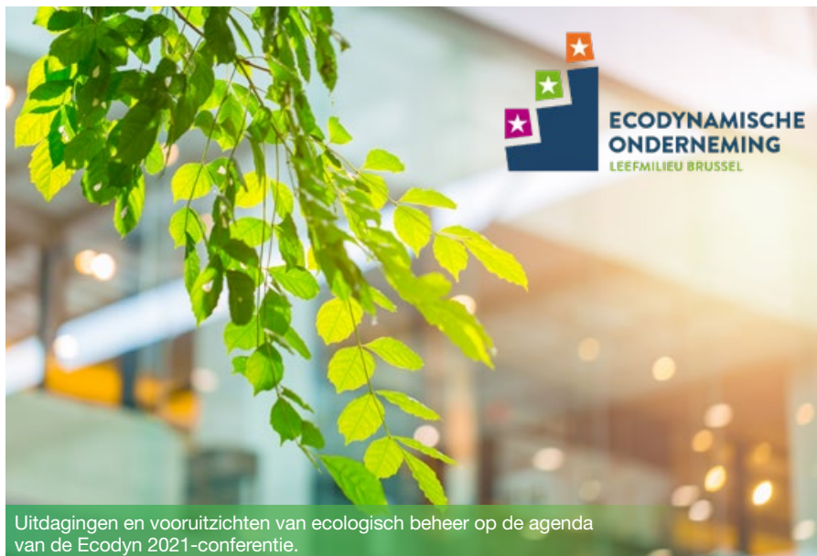
Uitdagingen en vooruitzichten van ecologisch beheer op de agenda van de Ecodyn 2021-conferentie.

Wat is de toekomst van ecobeheer? Dat was het thema van de Ecodyn Conference 2021 die in juni plaatsvond. Een terugblik op een editie die in het teken stond van de uitdagingen en perspectieven van ecobeheer en de huldiging van de laureaten die het label Ecodynamische Onderneming in de wacht sleepten!