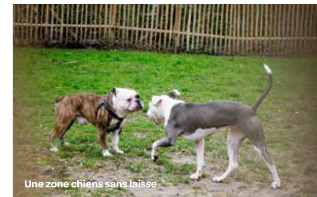
Une zone chiens sans laisse