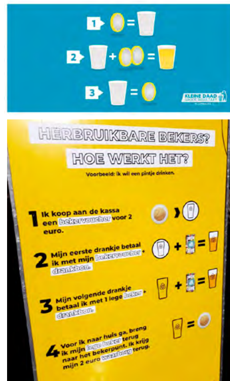
Voorbeeld communicatie op Studay 2019