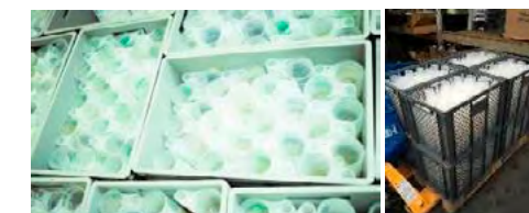
Gestapelde herbruikbare PP bekers

Informeer de toogverantwoordelijken vooraf schriftelijk over het systeem. Herhaal dit met een mondelinge briefing voor alle toogmedewerkers vlak voor het evenement.