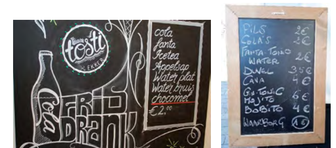
De drankenlijst op krijtborden: ecologisch en trendy