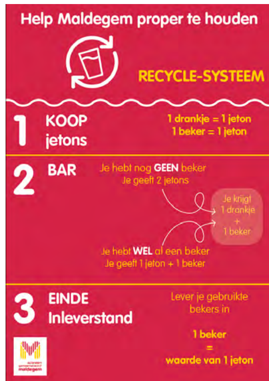
Voorbeeld communicatie in Maldegem