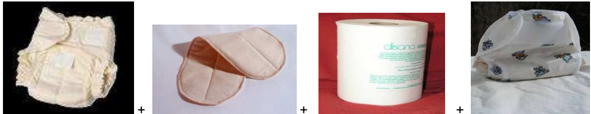
Lange en coton + protection supplémentaire en coton + feuilles de papier biodégradable en rouleau + culotte de protection

La nuit ou pour les siestes de l'après-midi, des protections supplémentaires (en coton) peuvent être ajoutées pour une plus grande absorption.