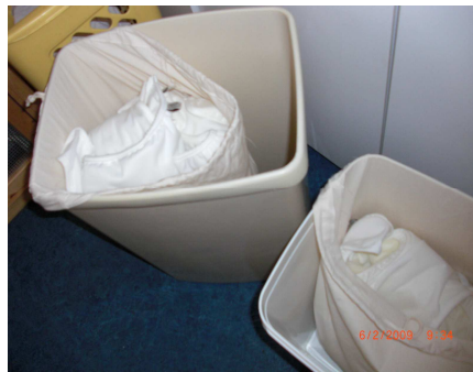
Différentes poubelles pour couches lavables

Cela demande un peu plus de place, mais c'est aussi une question d'organisation!