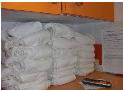
Langes lavables dans un milieu d'accueil

Cette fiche est destinée aux milieux d'accueil qui souhaitent introduire les langes lavables et est basée sur les expériences de projets pilotes réalisés par Bruxelles Environnement dans deux milieux d'accueil bruxellois en février-mars 2009. Un de ces milieux d'accueil est un milieu d'accueil subventionné d'environ 80 enfants, et l'autre un milieu d'accueil non-subventionné d'une capacité de 24 enfants.