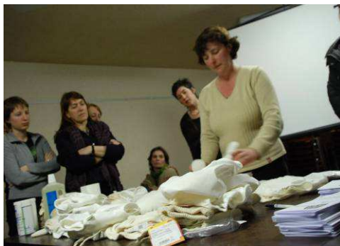
Le fournisseur explique les différents modèles de langes lavables

Vous pouvez inviter un fournisseur à venir présenter les différents modèles qui existent sur le marché. Si tous les acteurs sont impliqués dans le choix des langes, les chances de réussite s'en trouveront augmentées.