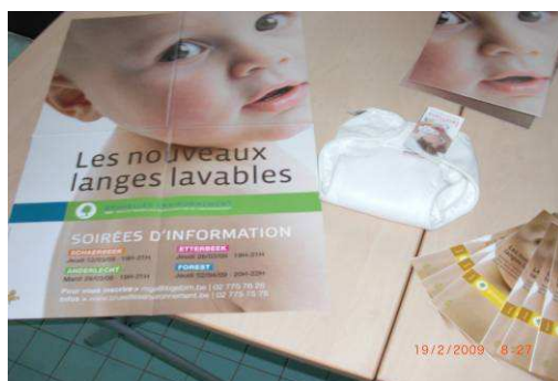
Affiche d'information sur les « nouveaux » langes lavables

La montagne de déchets que nos bambins produisent dès leur naissance est énorme : 280 kg de déchets de langes jetables par bébé et par an ! Pour toute la Région bruxelloise, cela représente 14.000 tonnes de déchets de langes jetables par an. En utilisant des langes réutilisables ou lavables, on évite donc de produire de nombreux déchets.