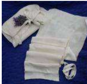
Un lange à nouer