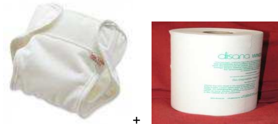
Lange entouré de la culotte de protection et contenant la protection supplémentaire + rouleau de feuilles de papier biodégradable.