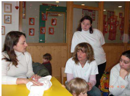
Réunion d'information où le fournisseur explique le fonctionnement des langes lavables aux puéricultrices

Vous pouvez inviter des parents ou des puéricultrices qui ont déjà utilisé des langes lavables et organiser une démonstration. La plupart des fournisseurs ou vendeurs de langes lavables seront également disposés à venir donner plus d'explications sur les langes lavables et leur utilisation. Autre possibilité : aller visiter un milieu d'accueil qui fonctionne déjà avec des langes réutilisables (voir Fiche 4 « Contacts utiles »).