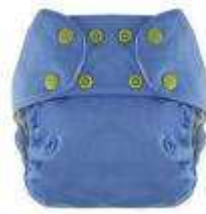
Lange du modèle « 3-en-1 »