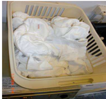
Panier à linge de langes lavables propres.

Vous pouvez décider de laver les langes en interne ou de les faire laver à l'extérieur. Faire appel à des services de lavage externe représente un coût supplémentaire. Mais s'ils sont organisés par votre commune, par exemple, cela peut faciliter le travail du personnel. (voir Fiche 4 « Contacts utiles » pour les coordonnées des services de lavage sur Bruxelles)