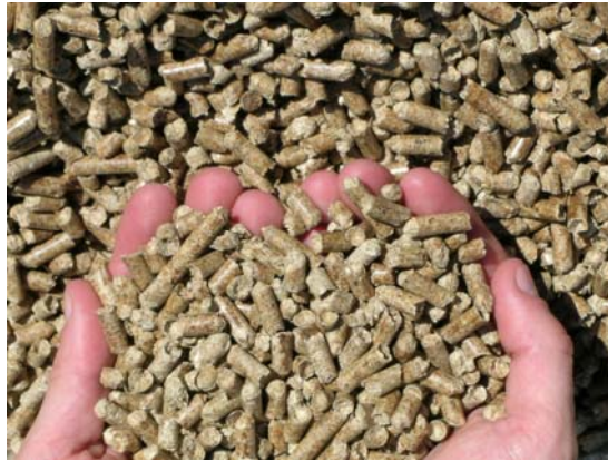
Figure 2 - Granulés de bois (ou pellets)