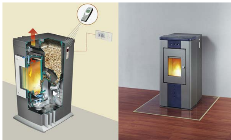
Figure 3 - Poêle à pellets (Rika, Autriche)

Les poêles sont constitués du réservoir à pellets situé en haut ou à l'arrière d'un foyer central où se déroule la combustion. Les pellets sont extraits automatiquement du réservoir à l'aide d'une vis sans fin et sont poussés ou tombent dans le foyer où ils sont brûlés. Le contrôle de l'apport en air optimise la combustion. Comme pour les poêles à bûches, la flamme est visible à travers une vitre. Les cendres, résidus de la combustion tombent dans un cendrier situé sous le foyer.