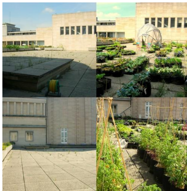
Le toit de la KBR avant/après... Pas de doute, c'est mieux maintenant !

Mais ce n'est pas tout. Bruxelles regorge d'espaces vides, inutilisés, ensoleillés et Le début des haricots a mis l'accent sur le potentiel énorme des toits plats . C'est pourquoi l'ASBL encourage aujourd'hui la multiplication de ce genre d'initiatives et ce, qu'il s'agisse d'un particulier disposant d'une terrasse ou d'un groupement souhaitant exploiter un vaste espace (quelques pistes de lieux à investir sur le blog : www.potage-toit.be/?page_id=552 ). Beaucoup de toits bruxellois ont toutes les qualités nécessaires pour être cultivés.