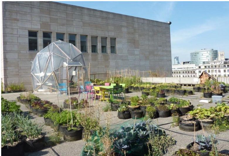
Une serre aux allures futuristes sert de couveuse aux jeunes plants.