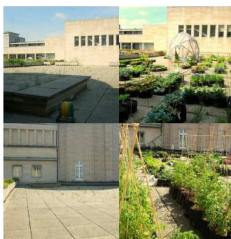
Het dak van de KBR voor/na ... Dat het nu beter is, lijdt geen twijfel!

Maar dat is niet alles ... Brussel loopt over met lege, onbenutte en zonnige ruimtes. Le début des haricots legde de klemtoon op het enorme potentieel van platte daken . Daarom moedigt de vzw de verbreiding van dit soort van initiatieven aan, of het nu gaat om een particulier met een terras of een groep die een groot oppervlak wil gebruiken (een paar mogelijkheden op de blog www.potage-toit.be/?page_id=552 ). Veel Brusselse daken beschikken over alle troeven voor de aanleg van een moestuin.