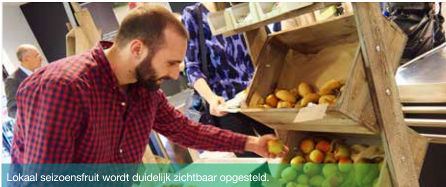
Lokaal seizoensfruit wordt duidelijk zichtbaar opgesteld.