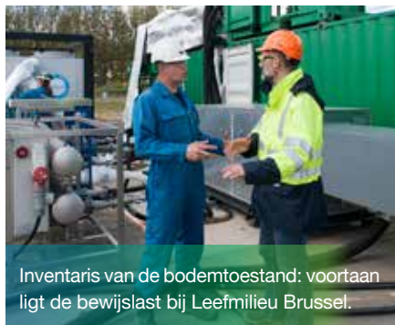
Inventaris van de bodemtoestand: voortaan ligt de bewijslast bij Leefmilieu Brussel.

Hoe de procedures voor het onderzoek en de sanering van verontreinigde bodems vergemakkelijken en versnellen? Hoe de burgers en bedrijven beter helpen om de daaraan gekoppelde kosten te financieren? Hoe een beter evenwicht bereiken tussen enerzijds milieu en gezondheid en anderzijds de sociaaleconomische uitdagingen?