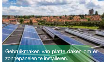
Gebruikmaken van platte daken om er zonnepanelen te installeren.

U maakt deel uit van de Brusselse overheid? Dan bent u de exclusieve begunstigde van twee doelgerichte maatregelen: SolarClick, een ambitieus programma om zonnepanelen te installeren, en NRClick, een compleet aanbod energiediensten.