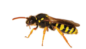
Nomada goodeniana Nomade commune Smalbandwespbij