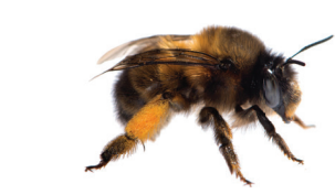
Anthophora plumipes Anthophore plumeuse Gewone sachembij