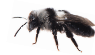
Andrena cineraria Andrène cinéraire Asbij