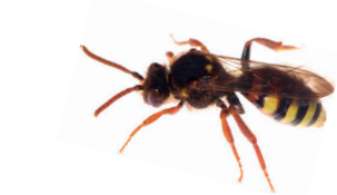
Nomada lathburiana Nomade poil-de-carotte Roodharige wespbij