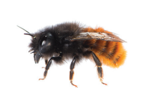
Osmia cornuta Osmie cornue Gehoornde metselbij