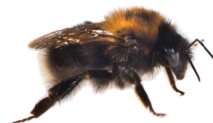
Bombus hypnorum Bourdon des arbres Boomhommel