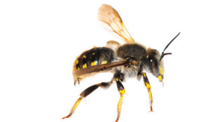
Anthidium manicatum Anthidie à manique Grote wolbij