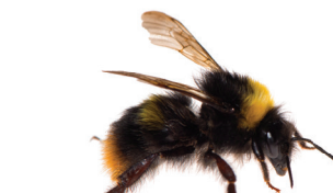
Bombus pratorum Bourdon des prés Weidehommel