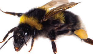
Bombus hortorum Bourdon des jardins Tuinhommel