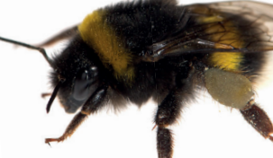
Bombus terrestris Bourdon terrestre Aardhommel