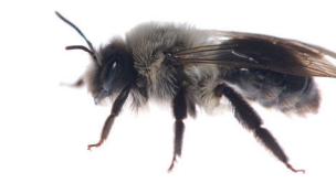
Andrena vaga Andrène vague Grijze zandbij