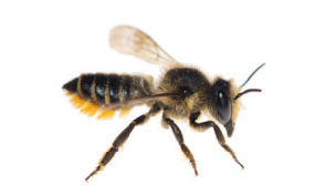
Megachile centuncularis Mégachile coupe-rose Tuinbladsnijder