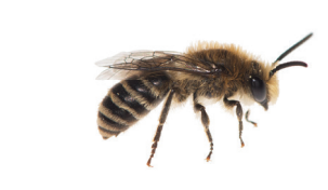
Colletes daviesanus Collète commun Wormkruidbij