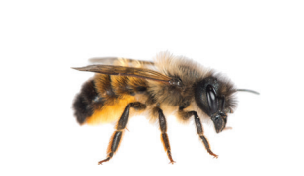
Osmia rufa (= bicornis ) Osmie rousse Rosse metselbij