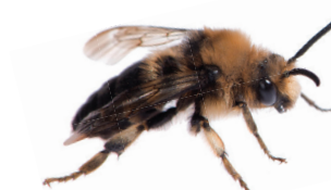
Melecta albifrons Mélècte commune Bruine rouwbij