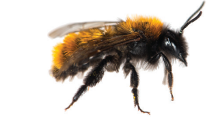
Andrena fulva Andrène fauve Vosje