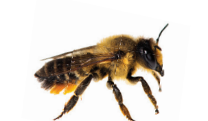
Megachile willughbiella Mégachile des jardins Grote bladsnijder