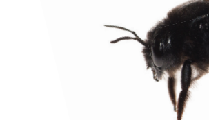
Xylocopa violacea Xylocope violet Blauwzwarte houtbij