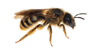
Halictus scabiosae Halicte de la Scabieuse Breedbandgroefbij