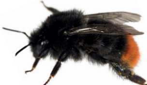
Bombus lapidarius Bourdon des pierres Steenhommel