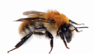
Bombus pascuorum Bourdon des champs Akkerhommel