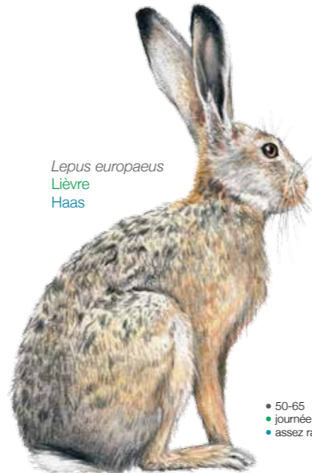
Lepus europaeus Lièvre Haas