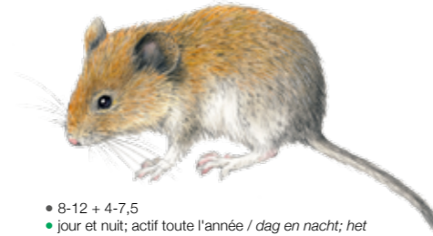
Myodes glareolus Campagnol roussâtre Rosse woelmuiz