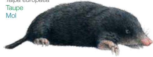
Talpa europaea Taupe Mol