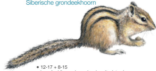
Tamias sibiricus Tamia de Sibérie Siberische grondeekhoorn