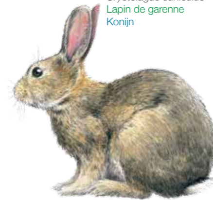
Oryctolagus cuniculus Lapin de garenne Konijn