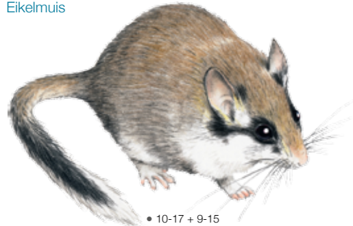
Eliomys quercinus Lérot Eikelmuiz