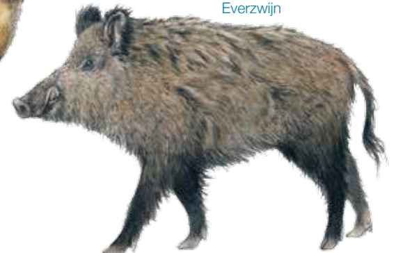
Sus scrofa Sanglier Everzwijn