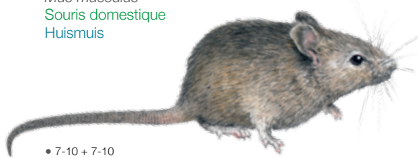
Mus musculus Souris domestique Huismuiz