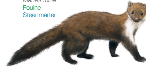
Martes foina Fouine Steenmarter