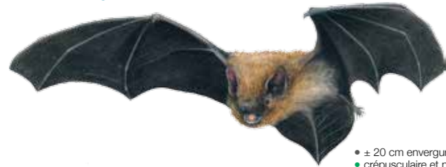
Pipistrellus pipistrellus Pipistrelle commune Gewone dwergvleermuis