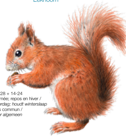
Sciurus vulgaris Ecureuil roux Eekhoorn