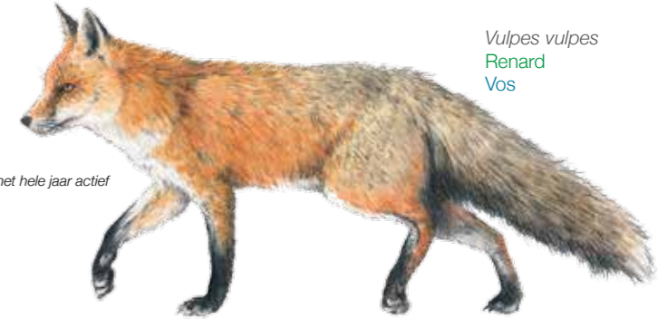
Vulpes vulpes Renard Vos