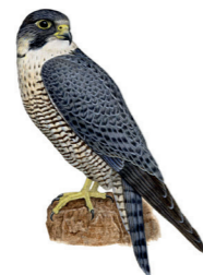
Falco peregrinus Faucon pèlerin Slechtvalk