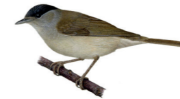
Sylvia atricapilla Fauvette à tête noire Zwartkop