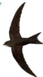
Apus apus Martinet noir Gierzwalv