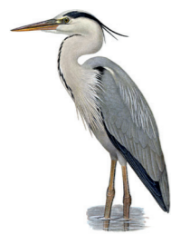
Ardea cinerea Héron cendré Blauwe reiger