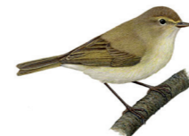
Phylloscopus collybita Pouillot véloce Tjiftjaf