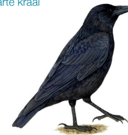
Corvus corone Corneille noire Zwarte kraai