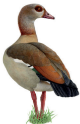
Alopochen aegyptiaca Oulette d'Égypte Nijlgans