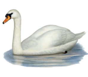
Cygnus olor Cygne tuberculé Knobbelzwaan