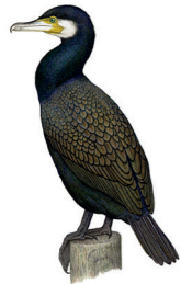
Phalacrocorax carbo Grand cormoran Aalscholver