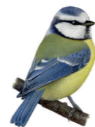
Cyanistes caeruleus Mésange bleue Pimpelmees