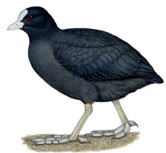
Fulica atra Foulque macroule Meerkoet