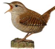
Troglodytes troglodytes Troglodyte mignon Winterkoning