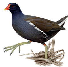
Gallinula chloropus Gallinule poule-d'eau Waterhoen