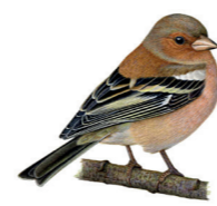
Fringilla coelebs Pinson des arbres Vink