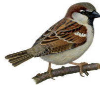
Passer domesticus Moineau domestique Huisemus