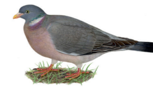
Columba palumbus Pigeon ramier Houtduif