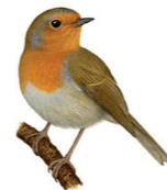
Erithacus rubecula Rougegorge familier Roodborst