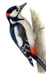
Dendrocopos major Pic épeiche Grote bonte specht