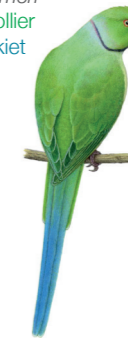
Psittacula krameri Perruche à collier Halsbandparkiet