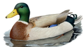
Anas platyrhynchos Canard colvert Wilde eend