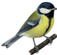
Parus major Mésange charbonnière Koolmees